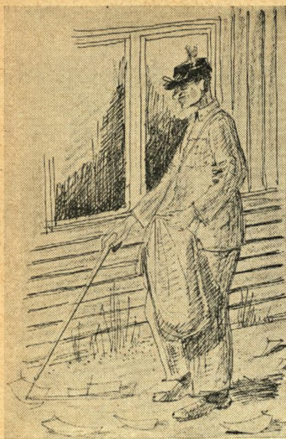
Papirsamler i Horserød.

sene kløvede luften under forsøgene på at sætte trumf bag ordene. Der var dog aldrig tilløb til noget i retning af uvenskab. Man skulle bare have luft, og det fik man. Venner og kammerater var man trods alt det, der skilte — og det var dejligt.