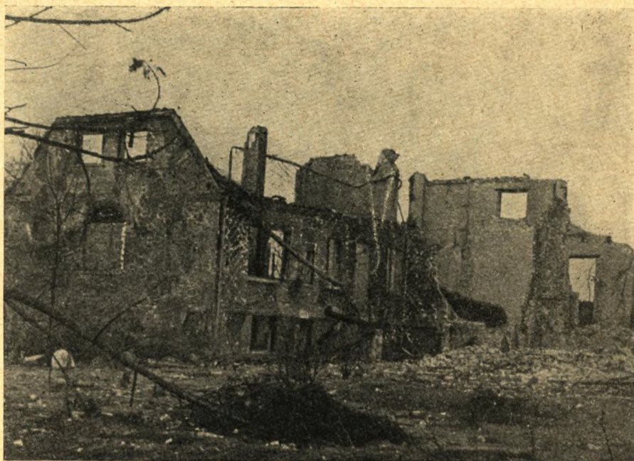
Hvad bomber og brand levnede af hovedbygningen.

Den 11. januar 1945 blev jeg selv arresteret og stiftede straks bekendtskab med de uhyggeligt snavsede og mørke fangehuller på husmandsskolen. Store var de jo ikke, og udstyret bestod af en fast træbriks og en tom konserverdåse til vor nødtørft. Væggene var berappede, og vinduet var ganske lille og sad højt oppe. Om aftenen fik vi kun lys, når en lampe, der var anbragt uden for cellerne i gangen, var tændt, — og det gav kun så meget, som der kunne trænge gennem et lille tilgitret hul over celledøren. Dørene havde kighul, som vi kunne iagttages igennem, de var foruden en kæmpelås forsynet med to mægtige jernskydere, en foroven og en forneden. Til samtlige celler var der eet toilet, een vaskekumme og eet fælles håndklæde. Forplejningen bestod af rugbrødshumpler med en anelse marmelade og sort kaffe til, der serveredes i ølglas. Noget, der minder om middagsmad, har jeg ikke set derude. Støjen fra kontorerne ovenover trængte tydeligt ned til os, men