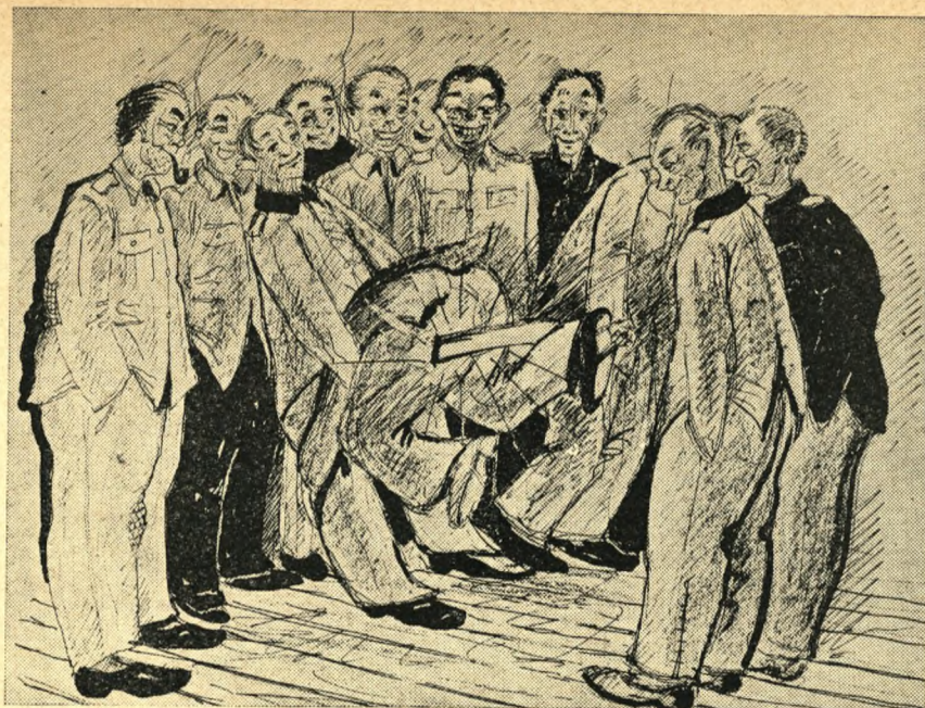
Gemytlig scene i Horserød

i barak 15s samlingsstue. Det gik stilt og højtideligt til. De besøgende, der var strømmet til for at bivuane begivenheden, turde knap nok ånde af frygt for at forstyrre de anstrengt grublende.