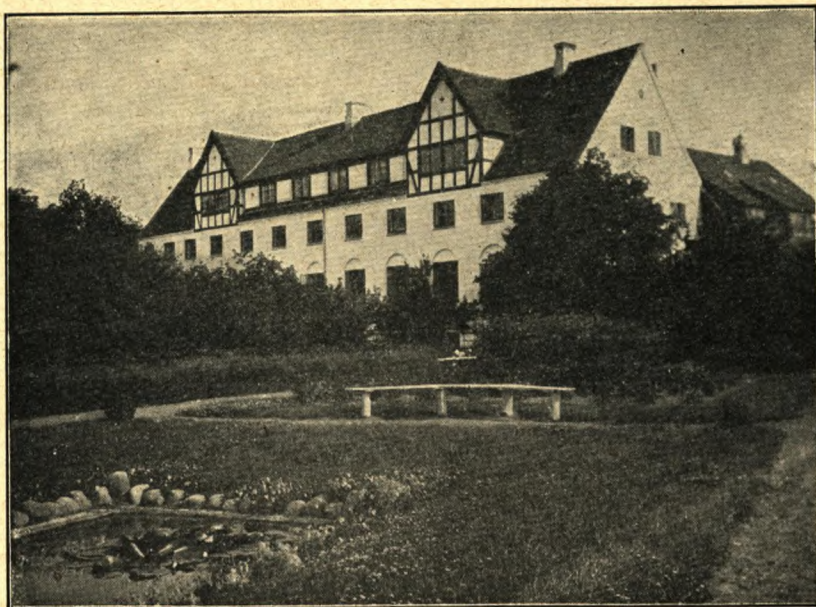
Husmandsskolen i Tarup ved Odense. Bombet 17. april 1945.

— Det var trist at måtte vige pladsen for Gestapo . Først blev alt inventar flyttet over i kursusbygningen, men inden længe måtte det også flyttes derfra. Vi selv kunne blive til den 25. oktober, men efter den tid måtte vi morgen og aften passere vagtposterne, hvis truende maskinpistoler ofte pegede efter os fra hjørnerne. Men stikkerne var dog værre. I deres frækhed og overmod true de os direkte med pistolerne mere end een gang. Øjensynlig gjorde Gestapo stor stads af dem, især når en af dem var blevet skudt og skulle begraves under meget omstændelige foranstaltninger. Vi