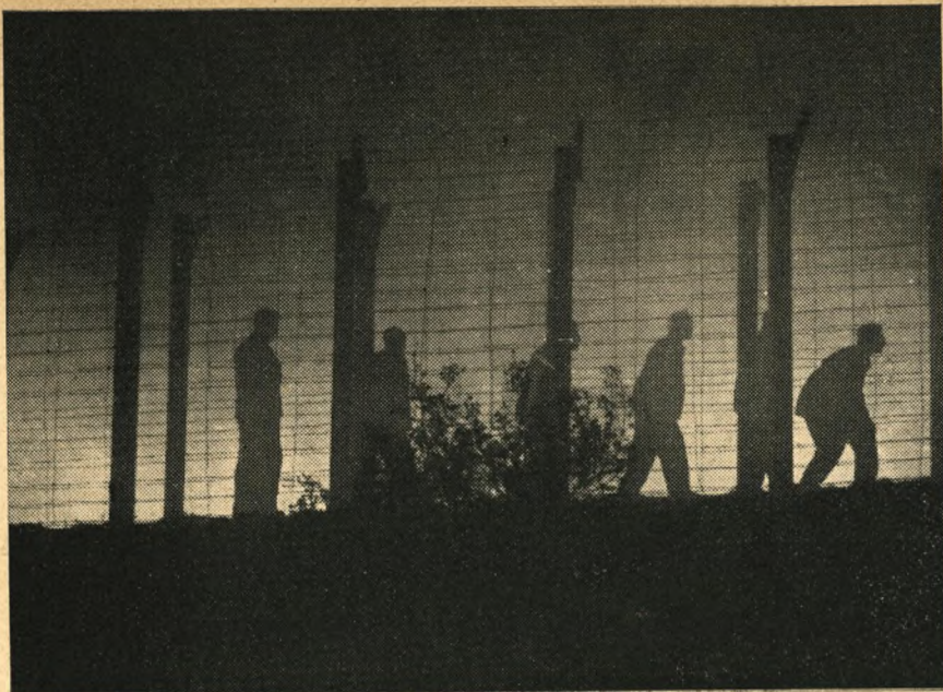
Situation fra kz-lejr-filmen: Det syvende kors.

de syv flygtede komme til at hænge i hvert sit kors. Det varede heller ikke mere end nogle få timer, så hang den første død på korset, så den næste o.s.v. Efter få dages forløb havde seks kors fået deres offer. Den syvende flygtning (Spencer Tracy) var ikke så let at få. Man følger hans flugt, hans nervøsitet og uro. Man følte sig påny hensat til den tid — man følte, at man selv var jaget, og at man var i samme båd som han. I 1936 var der endnu en spinkel modstandsbevægelse i Tyskland. Den fik han langt om længe kontakt med, og det lykkedes ham at slippe bort. Men hvor har man oplevet meget inden da.