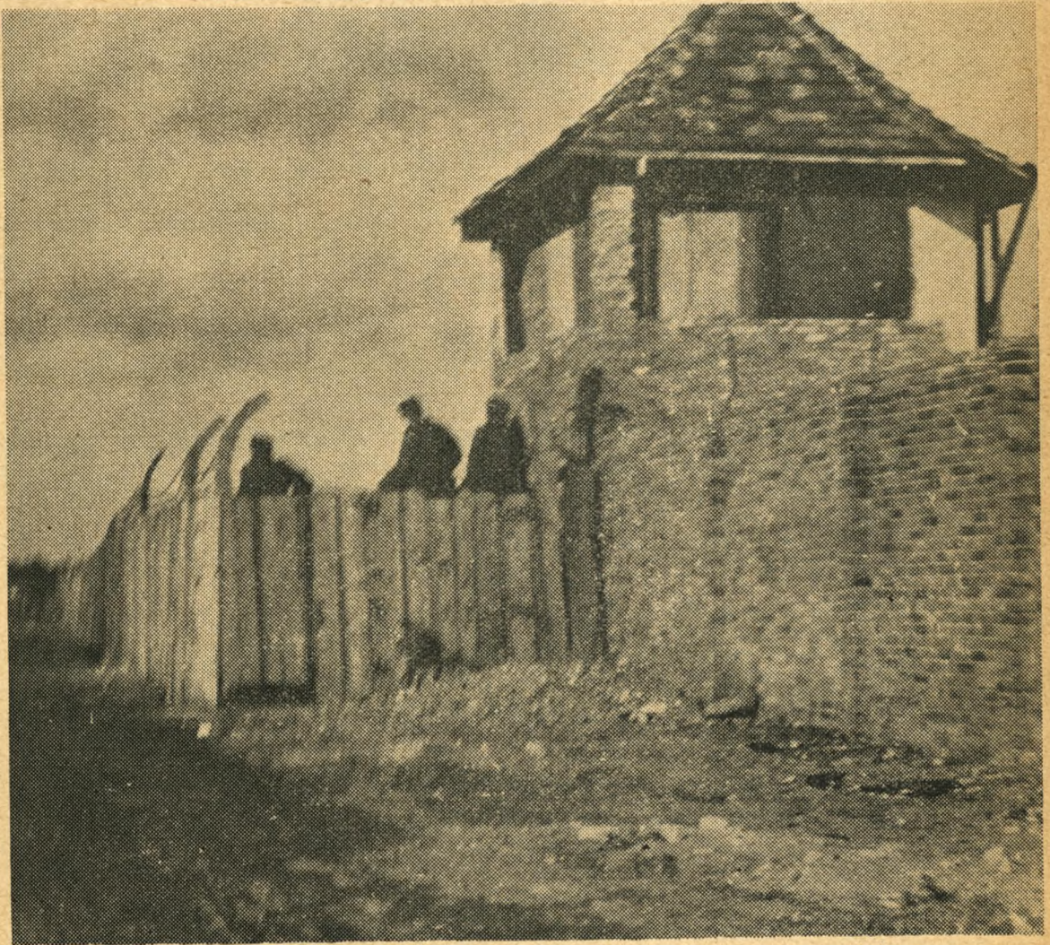
Kz-lejren Sachsenhausen (ved Berlin) i dag. Vagtposterne er russere. Billedet er taget illegalt med småbilledkamera.

Inde i bladet: Besøg i Buchenwald ★ Kriminel fange taler frit fra leveren ★ Da fængsels- personalet narrede tyskerne ★ Bog om de hektiske oktoberdage i 1943 ★ Der blev rift om pladsen ★ FN-noter ★ Gestapofangernes landsstævne.