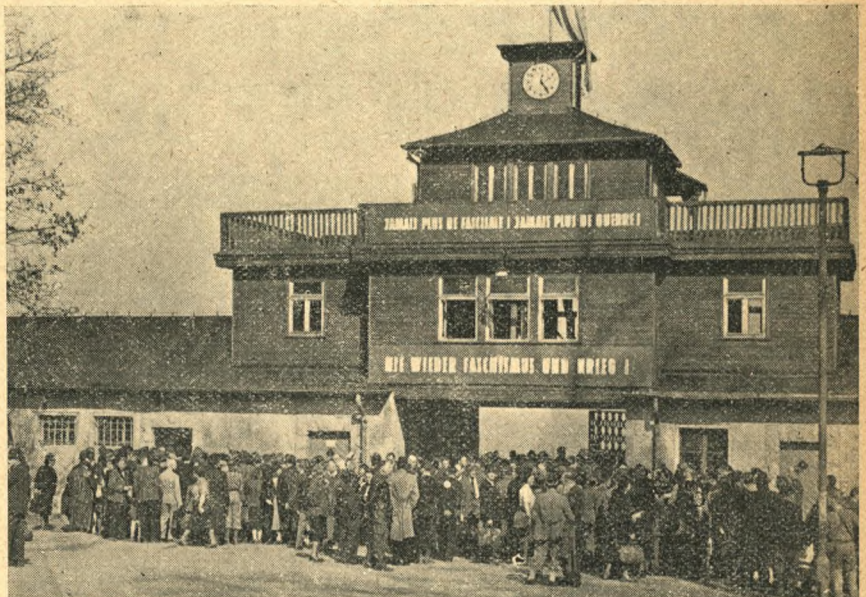
Administrationsbygningen med hovedindgangen til den indre lejr i Buchenwald fotograferet fornylig, da tidligere Buchenwald-fanger var samlet i Weimar til et internationalt stævne.

Latrin- og vaskebygningen, der hørte til Kleinlager, den bygning som politifolkene kaldte »klubben«, står delvis