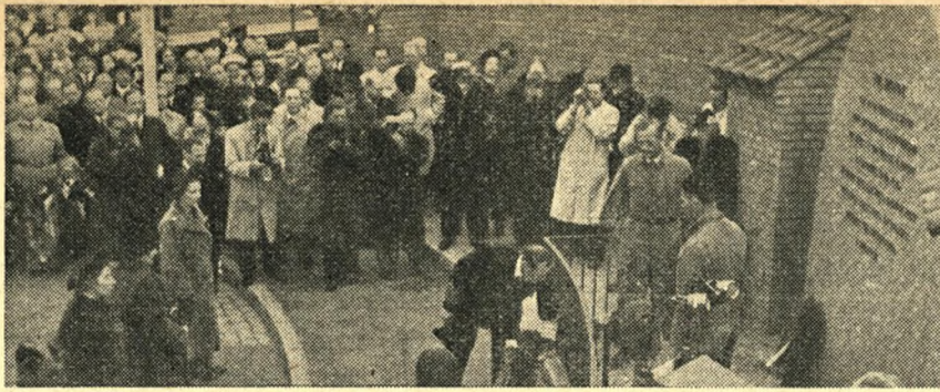
Dronning Alexandrine overværer sammen med bl. a. det nuværende kongepar og det nuværende tronfølgerpar afsløringen i Hellerup havn af mindesmærket for de illegale transportør til Sverige.

talte et sagte: »Gud velsigne kongen og dronningen«.