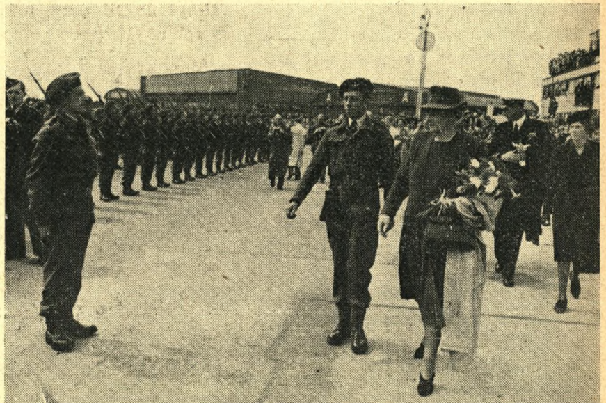
Dronning Alexandrine i Kastrup lufthavn under det første besøg af RAF efter befrielsen

Som prinsesse var hun meget afholdt af den mecklenborgske befolkning på grund af sin sympatiske personlighed og sit lyse, venlige og utvungne væsen. Søsteren, kronprinsesse Cecilie, skriver i sine »Erinnerungen«, at prinsesse Alexandrine — eller Adini, som hendes kælenavn lød — »var husets midtpunkt, som forstod at skabe fred og harmoni. Dertil var hun uegenlytten selv. Aldrig krævede hun noget for sig selv, aldrig skød hun sig selv i forgrunden, stadig søgte hun at glæde andre, selvom det skulle være på bekostning af sine egne ønsker«. Sådant kender vi danske hende også.