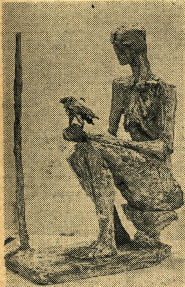
Elizabeth Frinks forslag

Har medlemmerne forslag, der ønskes behandlet på generalforsamlingen, må de være formanden i hænde 8 dage før generalforsamlingen. Såvel aktive som passive medlemmer har adgang, men kun de aktive har stemmeret.