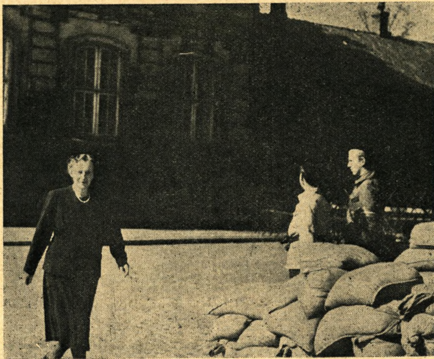
Frihedskæmperne har overtaget bevogtningen af Amalienborg. Afspærringen ses tydeligt til højre i billedet.