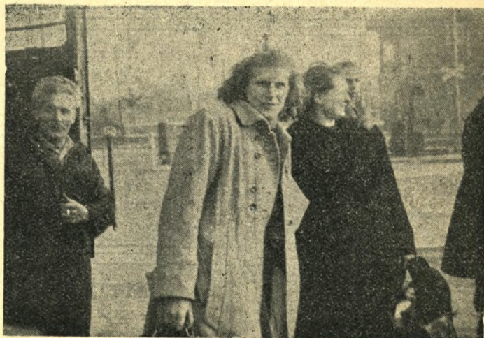
De venter på køreljighed med en lastvogn

Og så pegede læreren mod tavlen med Albert Schweitzers ord: I må aldrig glemme jeres ungdoms idealer.