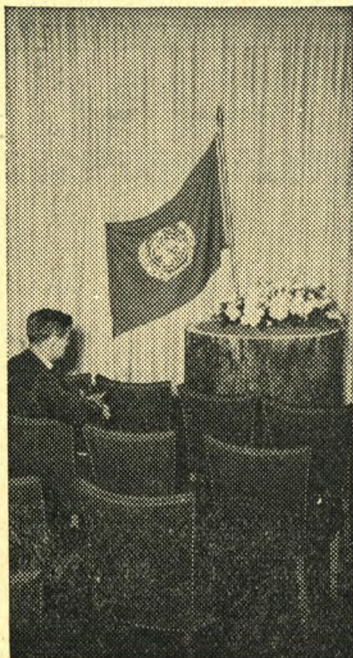
I F.N.s hovedkvarter i New York, hvor mennesker af mange forskellige trosbekendelser samles, findes et særligt værelse, hvor de delegerede kan hente inspiration gennem bøn eller stille eftertanke.