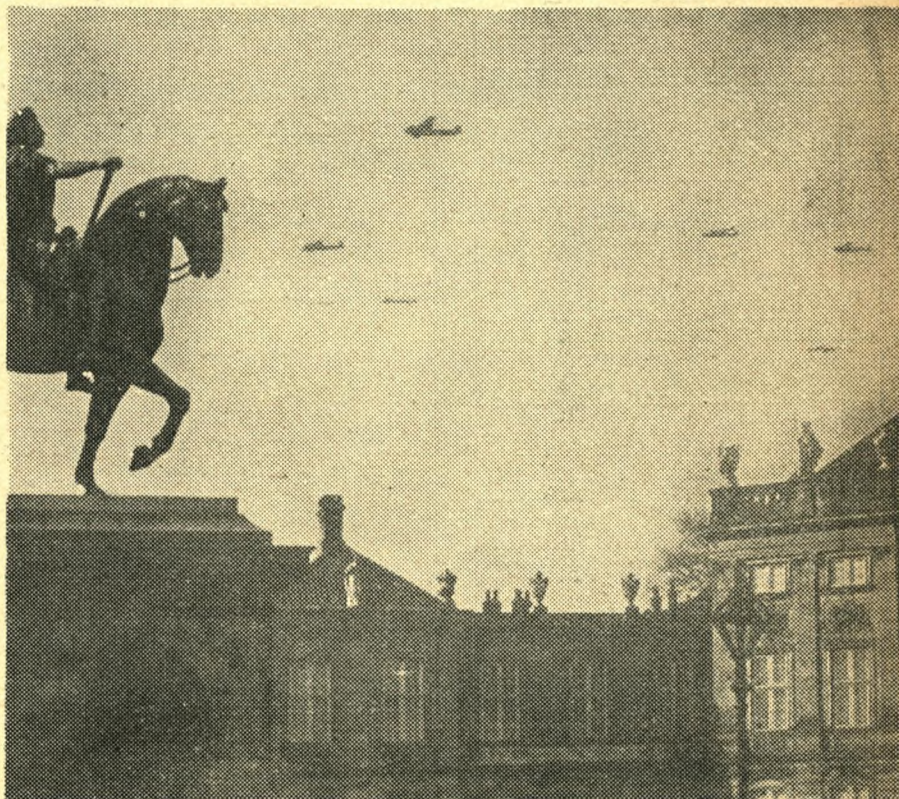
Tyske bombeflyvere drøner ind over København om morgenen den 9. april. Billedet er taget fra Amalienborg.

Samtidig med, at et ærbødigt buk gives for den enorme arbejdspræstation, der her forligger, må det imidlertid tilføjes, at den oprindelige hensigt med kommissionen er forsvundet i blå tåge. Der bliver ingen rigsretssager. Der bliver ingen domme eller renavskninger — til sin tid formentlig en folketings-