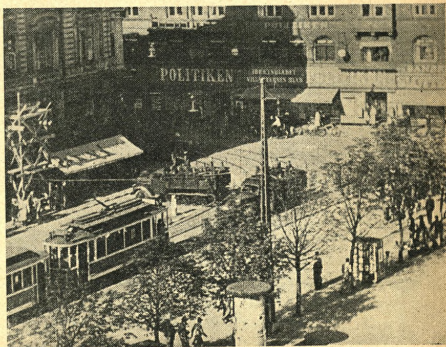
Rådhuspladsen den 29. august 1943.