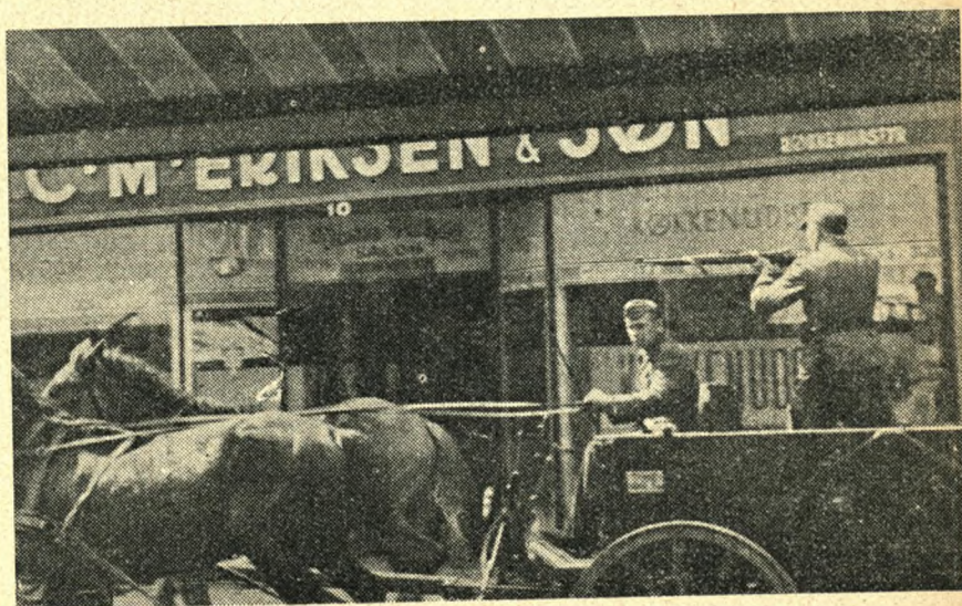
Tysk »promenadekørsel« skal vække respekt i en respektløs befolkning.

I juni og juli måneder tog sabottagen herhjemme fart. Man kan næsten tale om en generaloffensiv overfor tyskerne, der mange steder støttedes af lokale mindre strejker, hvor tyskernes overgreb blev for utålelige. I begyndelsen af juli provokerede frikorpsfolkene en række uroligheder i København, og landet blev i det hele så uroligt, at dr. Best i den første uge af august stillede en række krav til