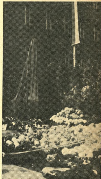
Før afsløringen var monumentet tildækket med sort klæde, men et væld af blomster talte om liv i det dystre kapitel i Tysklands historie. Sledet for monumentets beliggenhed er Bendlerstrasse, hvor oprøret begyndte. Det blev som bekendt knust af Hitlers SS-folk.

I kapitlet om den »borgerlige opposition« berettes om den tyske ungdomsbevægelses endeligt — spejdere og vandrefugle fandt døden i k-z-lejrene og under faldøksen, tit forladt og forrådt af deres ældre rådgivere, ensomme unge martyrer. Særlig kendt blev studenterbevægelsen »die weisse Rose« i München under ledelse af søsken-