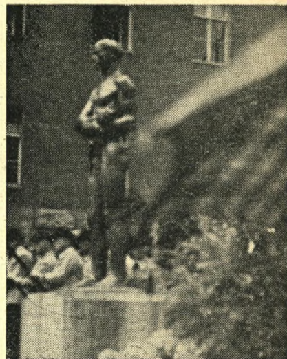
Den 19. juli 1953 afsløredes monumentet til ære for de ledende mænd i opstanden mod Hitler den 20. juli 1944. Afsøringen skete i silende regn — men i afsøringøjeblikket fandt en solstråle ned til den dystre baggård, hvor monumentet er opstillet.

Odense 4-maj-kollegiums fond er nu oppe på 333.000 kr. 42 af de 56 værelser har nu fået navne.