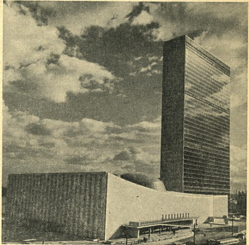
FNs hovedbygning i New York er centralen for et vidt forgrenet genopbygningsarbejde, der spænder over det meste af jordkloden.

AUSCHWITZ ✱ BERGEN BELSEN ✱ BUCHENWALD ✱ DACHAU ✱ HUSUM ✱ NEUENGAMME ✱ PORTA ✱ RAVENSBRÜCK ✱ SACHSENHAUSEN ✱ STUTTHOF ✱ FRÖSLEV ✱ HÖRSERÖD ✱ SHELLHUSET ✱ VESTRE FÆNGSEL