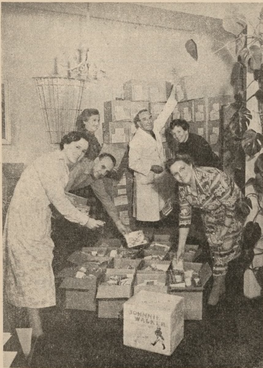
Personalet på Kammeraternes Hjelpefonds kontor gør julepakkerne klar sammen med særlige hjælpere

til at arrangere stævne for, og vore 16000 støtteabonnenter og vore ca. 4000 annoncører har sikkert heller ikke tegnet sig, for at vi skal anvende Pigtråds overskud til et stævne. Vi må derfor gennemføre stævnet uden at angribe de midler, der er indgået til direkte hjælp. Vi skal bruge 35.000 kr.