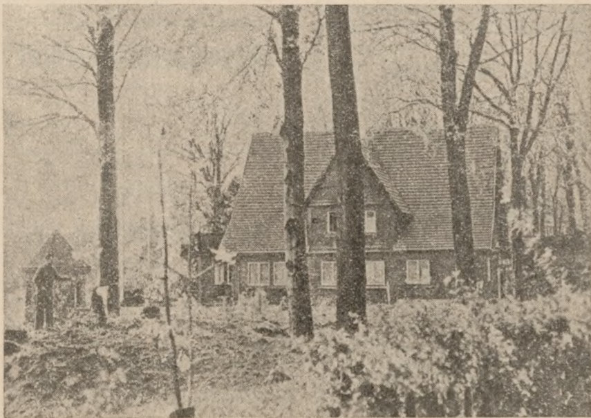
I denne skønne villa sikrede Buchenwald-lejrens berygtede kommandant, SS-Standartenführer Koch sig en behagelig tilværelse — indtil nazisternes militære nederlag

Han var vel en af de største sadder i lejren. Under en rundgang bemærkede han en fange, hvis nøgne krop var dækket af tatoveringer. Han kaldte på fangen og befalede ham at følge med sig. Nogle dage senere vidste man, at fangen var død under hemmelighedsfulde om-