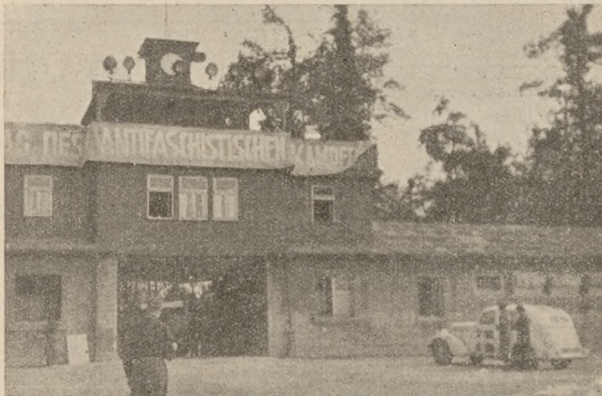
Administrationsbygningen med hovedindgangen til den indre lejr i Buchenwald.

Under arbejdet havde man desuden nogle fangefunktionærer, der kaldtes »Kapo« og »Vorarbeiter«. Disse var ligeledes udtaget blandt fanger, og bortset fra enkelte undtagelser misbrugte de deres magt. Mange af disse ihjelslog under arbejdet deres fangekammerater, hvis de fandt det nødvendigt af hensyn til at afstive deres egen position. I så henseende var der ingen større forskel på de politiske og de kriminelle (røde og grønne).