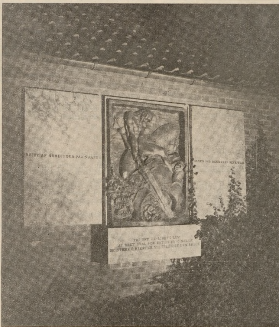
Det snuske relief, der sidder på ydervægen af frøhedskollegiet i Aalborg, er nu projektørbelyst aften og nat. Relieffet symboliserer det urge Danmark, der rejser sig til kamp for vort lands frihed, og taler sit tavse sprog om den seje modstandskæmp, for hvilken den 29. august 1943 blev en afgørende dag.