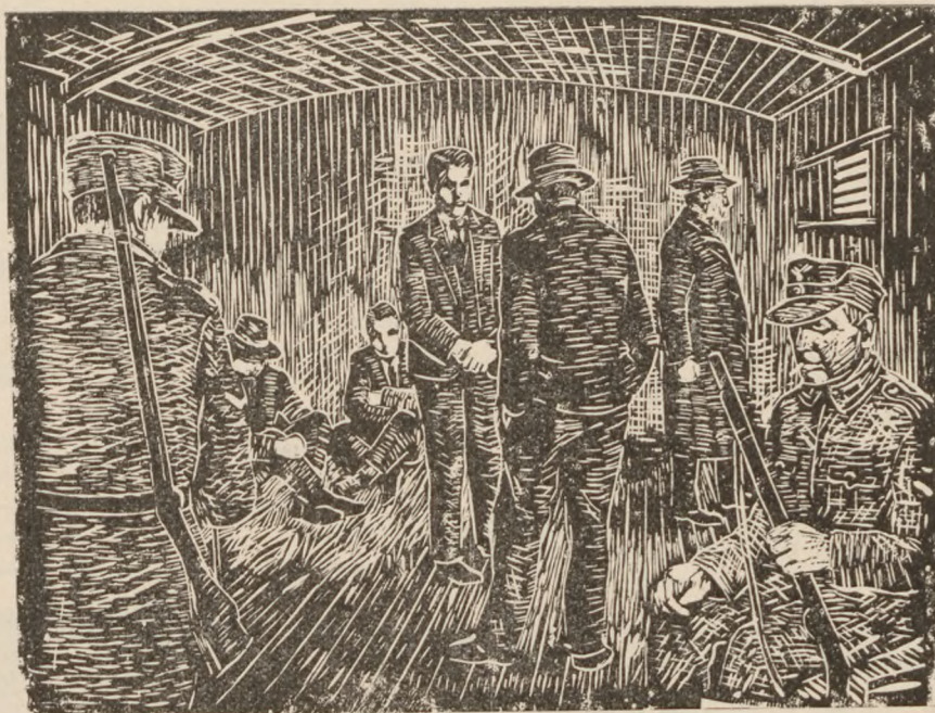
Bag lokomotivet var en kreaturvogn med lidt halm. Her tog vi plads og betragtede toget.

Vi snakkede med folk på peronen, fik en sendt til landbetjentens bror, der var købmand i Esbjerg og en anden til bageren efter flere basser. Købmanden lod snart høre