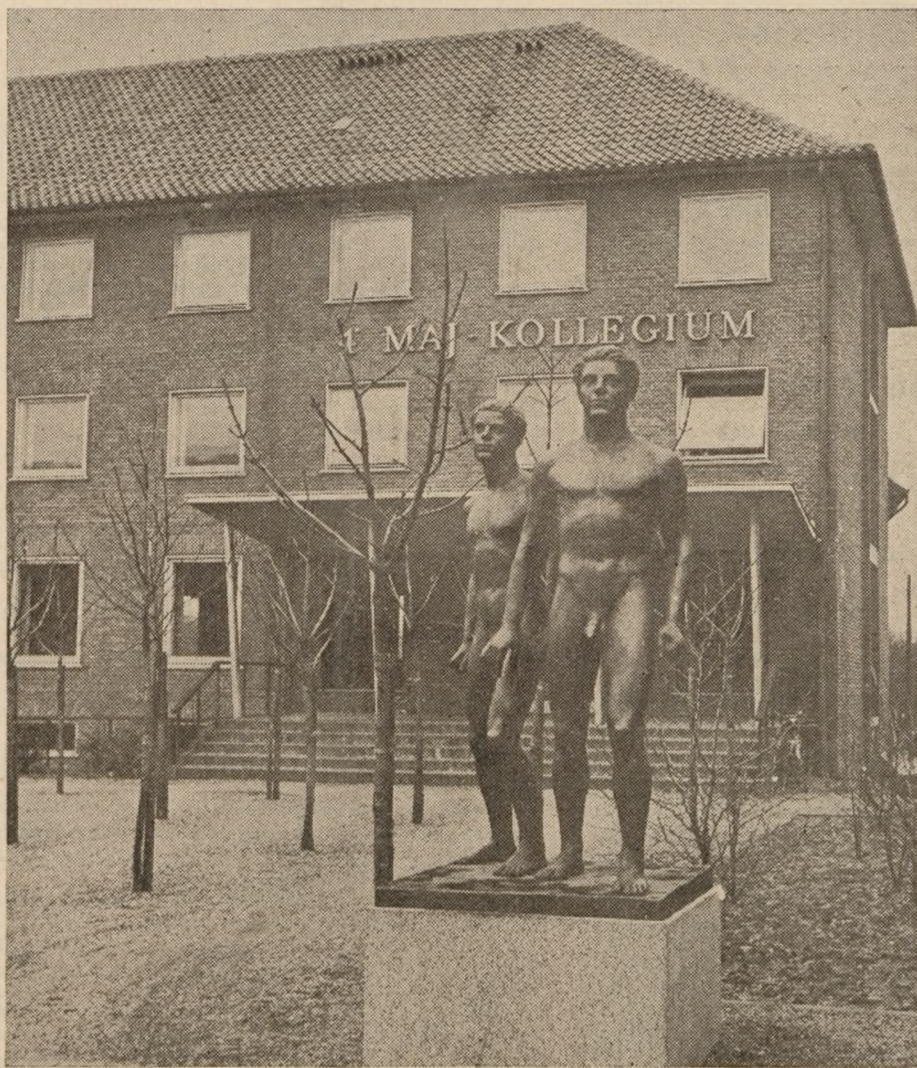
Gudmundsen Holmgrens dobbeltstatue foran 4.-maj-kollegiet i Esbjerg. Den ældre er forrest, og han strækker sin hånd let beskyttende tilbage, idet han bremser drengen lidt, mens han selv roligt imødeser fjenden og afventer det gunstige øjeblik.