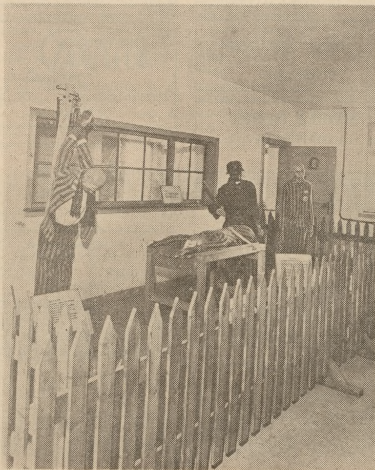
Det kunne være Buchenwald, men er Dachau. Voksfigurerne viser i det tidligere krematorium de specielle gestapometoder

Fra grundlæggelsen af Buchenwald og til 1945 er mindst 33462 fanger døde, heri ikke medregnet de henrettede eller de fanger, der blev sendt på dødstransporter. Det samlede tal på døde i Buchenwald ligger sikkert på ca. 55.000 i løbet