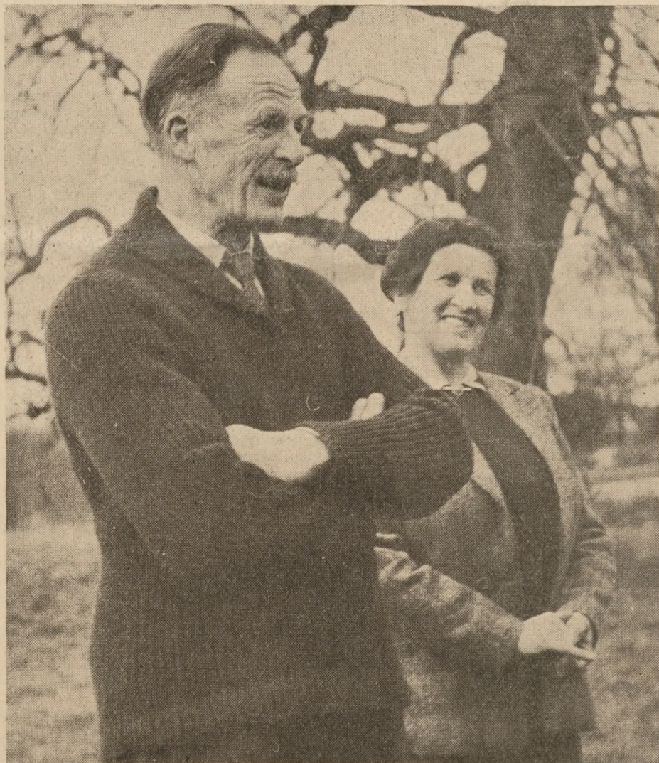
Danmarks befrielsesgeneral, general Dewing, lever i dag delvis af at dyrke og sælge blomster og frugt fra eget gartneri. Næst efter England står Danmark hans hjerte nærmest. (Læs iøvrigt side 155)