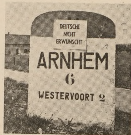
I Holland nøjes man ikke med at snakke om følelserne overfor eventuelle store tyske invasioner af turister. Man har her givet følelserne et synligt udslag.