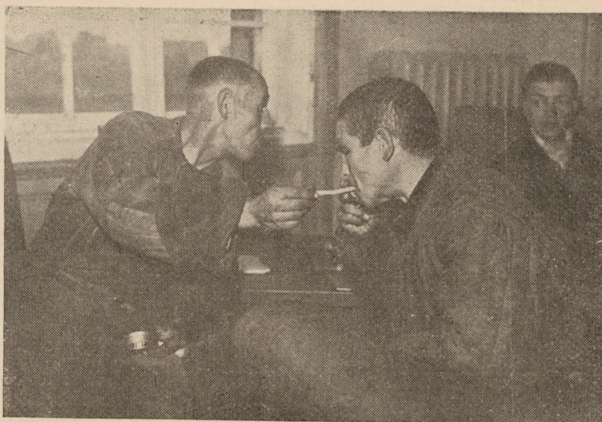
Tyske krigsfanger, der er vendt hjem fra Rusland. De bærer endnu deres arbejdstøj fra Sibirien.

rere og dommere udklækkedes i forbavsende kort tid på lægmandsskoler.