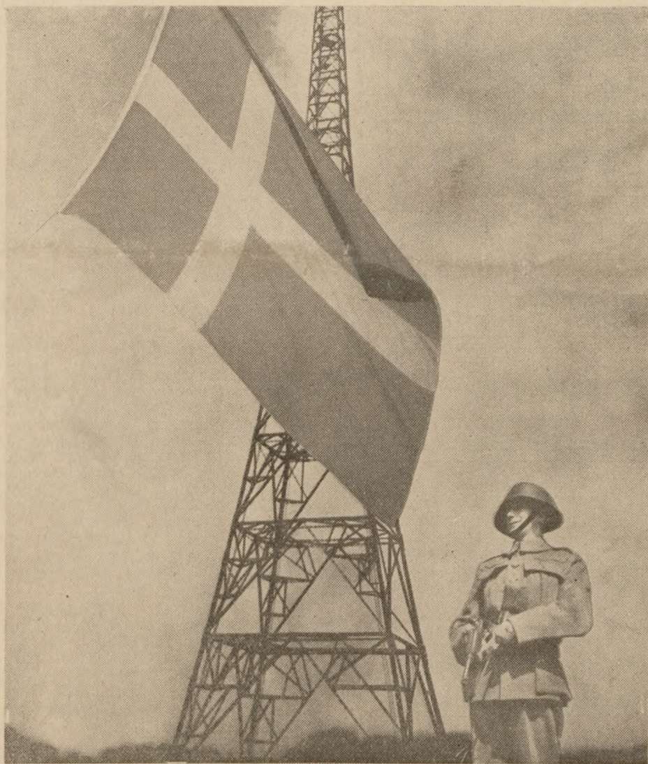
På vagt for Danmark