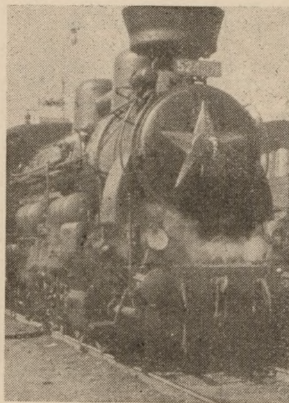
Også lokomotiverne tages i brug i propagandaens tjeneste ved prydelse af Sovjet-stjernen. Det er et almindeligt syn bag jerntæppet.

Eller er et »kaserneret folkepolitik« ingen armé? Politik, der ligger i kaserner: man plejer at kalde den slags for en hær. For at blive klar over det, behøver man ikke at fordybe sig i bøger eller de nævnte beretninger; man kan stole på, hvad man ser — og hvad man hører, bare på et eneste besøg i Vest- og Østberlin. Der kommer for tiden tusinder af tyske krigsfanger hjem fra Rusland, der uafhængigt af hinanden fortæller de samme kendsgerninger om forholdene i de russiske arbejdslejre, hvor de var sammen med russiske politiske fanger — den tyske tidligere marxist, senere teolog Helmut Gollwitzer, som fik lov til forholdsvis frit at bevæge sig i Rusland under sit årelange fangenskab, skildrer med en forbløffende saglighed forholdene i Sovjetrusland i bogen: Und führer, wohin Du nicht willst. (München: Kaiser Verlag 1952). Han så, hvad delegationer aldrig får at se — han talte russisk; han levede i flere år også iblandt russiske bønder og intellektuelle, stadig som krigsfange, som sovjetterne mente at kunne »omskole« og derfor gav en vis margin af frihed. Og resultatet, han omsider når til: det var lige meget, om jeg befandt mig inden for eller