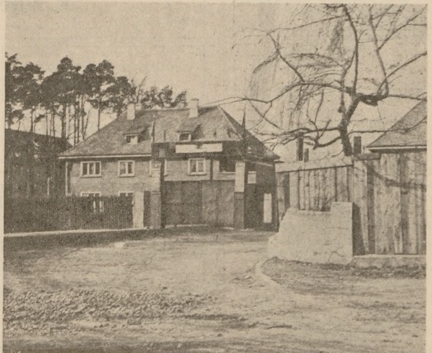
Sachsenhausen benyttedes de første år efter Tysklands kapitulation stadig til fangelejr, og flere tidligere fanger fra nazitiden havde det uheld at havne i lejren igen. Nu er der ikke længere fanger i lejren, men den var så sent som i foråret 1953 stadig i de sovjetrussiske troppers besiddelse, og der var ingen adgang for tidligere fanger, der ønskede at aflægge lejren besøg. Billedet, der viser hovedindgangen til lejren fotograferet med et skjult mikrokamera, er indsmuglet fra østzonen.