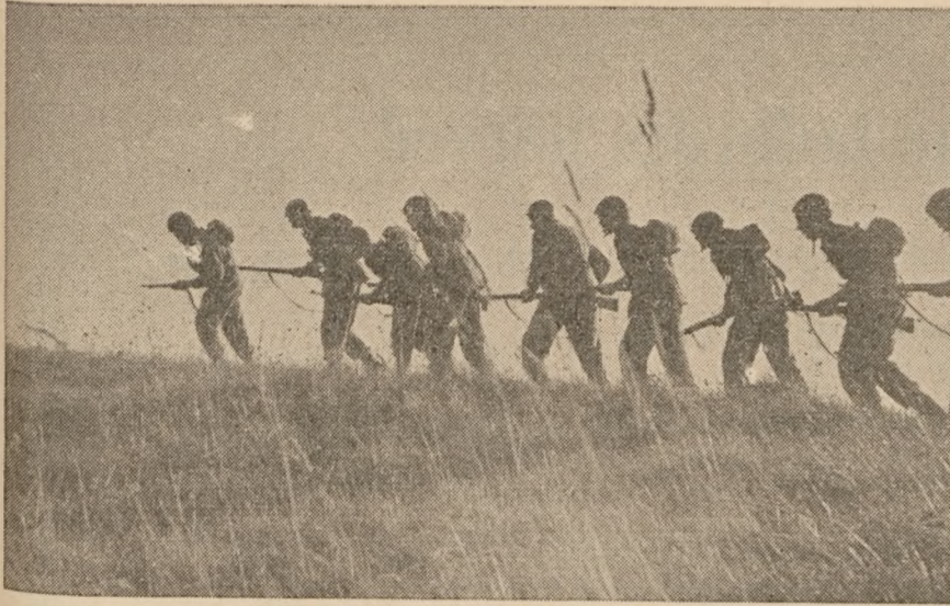
I 1949 blev hjemmeværnet lovfæstet og arbejdet fik mere militært præg. Her er en hjemmeværnsgruppe under fremrykning.

kolonnes sabotage, at rykke ud til bevogtning af alle livs- og krigsvigtige funktioner.