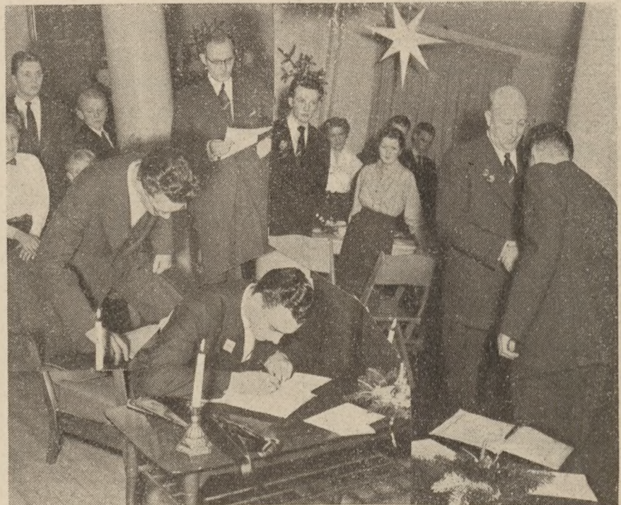
4. MAJ-KOLLEGIET i Esbjerg har holdt julefest. De ca. 90 deltagere samledes om kaffebordene i den smukt pyntede sal.