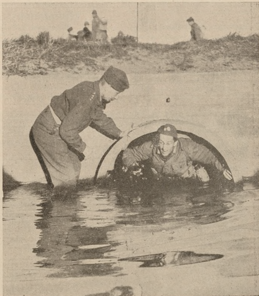
Kamppatruljerne er hjemmeværnets elitesoldater. Uddannelsen er grundig og krævende.

Og endelig, for det fjerde, er det hjemmeværnets opgave, i det øjeblik der er grund til at befrygte en 5.