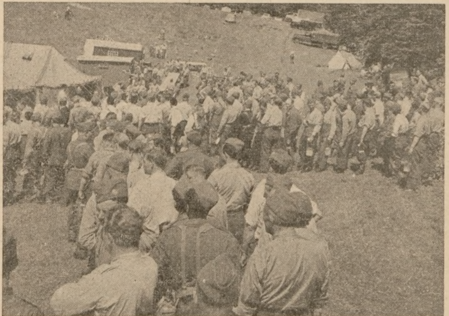
På week-end kurser opleves hjemmeværnsskammeratskabet under hyggelige friluftsførhold.