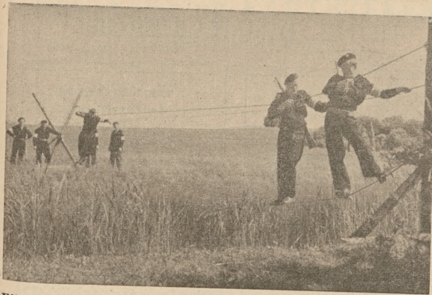
Efter modstandsbevægelsen organiseredes Danske hjemmeværnsforeninger. Udstyret var vel blandet, men ånden god.

ter det, der er parolen for al guerillakrig: »Slå til og løb!« Men læn- gere kamp med en større fjendtlig styrke, det var lige så lidt en op- gave for modstandsbevægelsen, som det vil være en opgave for et hjem- meværn.