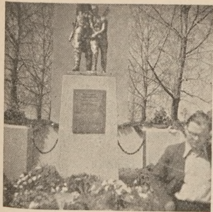
Mindesmærket, der er rejst for at hædre ofrene fra Sachsenhausen, er anbragt på galgepladsen.

efterfulgtes af »Aktion Gewitter«, førte mange ofre til Sachsenhausen, deriblandt flere højere officerer og mange hundrede berlinere og leipzigere, hvoraf de fleste dog hurtigt blev løsladt.