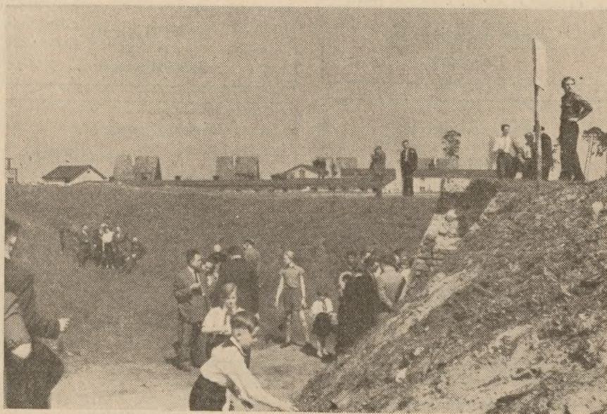
Skydegrav i Sachsenhausen. Bagved ses Industriehof med gaskammer og krematorie ovne.