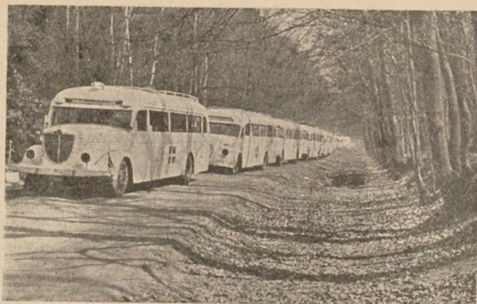
De hvide busser ved Fredrichsruhe uden for Hamborg den 19. april 1945, klar til indsats

gled det fra Berlin mod Hamborg, fra Oranienborg til Neuengamme, det vil sige, vi vidste ikke med det samme, hvor vi skulle hen, men rygterne havde jo dog fortalt et og andet, og i dette tilfælde fæstede vi nogen lid til rygterne. — Svenskerne talte jo nu med om vor skæbne.