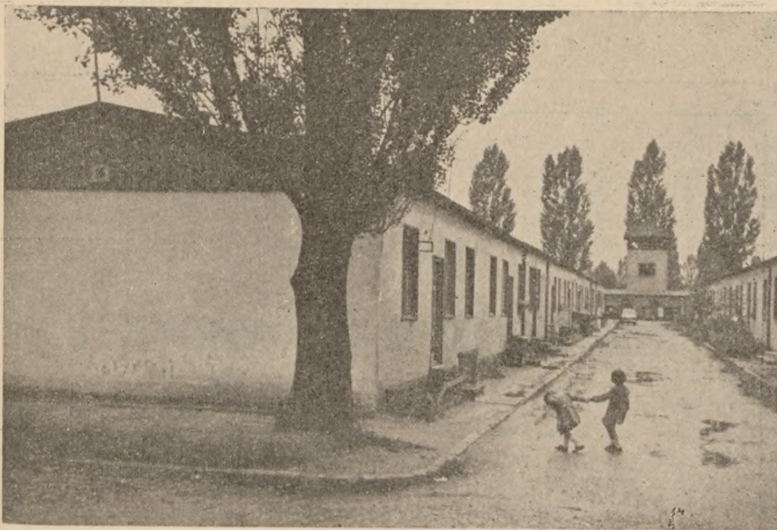
Dachau, barak 19.