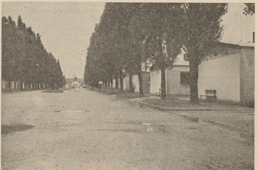
Dachau, hovedgaden igennem lejren.

Krematorieområdet ligger stadig adskilt fra det øvrige med cementmure. Indgangene er bevogtet af amerikanere. Der er indrettet en