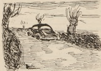
— Deres overmaling af landevejene med kluntede hagekors vandt dem ingen medløbere.

De mere folkelige, i hvert fald umilitære, bevægelser er tidligere nævnt. Men det kan være lærerigt at se, hvilket gravmæle førerne for dem fik fra tysk side, når man ikke længer kunne udnytte dem.