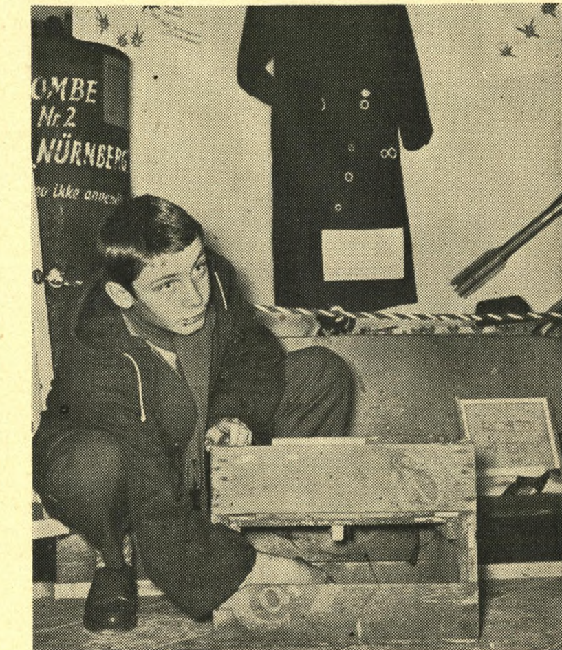
Caspar med den berømte ølkasse, hvis sprængstof forvandlede Forum til et „fuglebur“. Bagest ses et af Frihedsmuseets interessanteste klenodier: Sabotørens overfrakke. Den har ni skudhuller. De syv er tyske kugler, mens modstandsmanden selv lavede de to, da han skød ud gennem frakken. Modstandsmanden slap levende. Frakken flagrede nemlig om ham, da den og ikke han blev ramt under flugten.

Men hvordan virker museet på dem, for hvem besættelsestid og modstandskamp allerede er blevet historie — altså dem, der dengang var for små til overhovedet at fornemme noget af