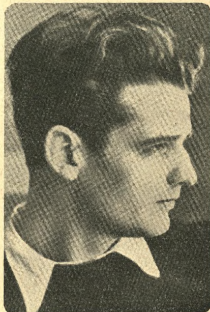
Inge Scholls broder hed Hans Scholl. Han var født i Ulm den 22. september 1918. Han var medicinsk student og blev henrettet samme dag som søsteren, nemlig den 22. februar 1943.

Først lidt efter lidt begyndte tvivlen at melde sig. Hans samlede på folkesange fra alle lande, og han elskede at synge dem, mens kammeraterne lyttede. Men så en dag havde han fået at vide, at føreren havde forbudt de sange. Han lo af det, og så truede de ham med straf, hvis han fortsat sang dem. Det var ubegribeligt. De var dog så smukke. Og nu måtte han ikke synge dem, blot fordi de var skrevet af andre folk. Snart efter oplevede han, at troppens fører konfiskerede hans yndlingsbog, Ste-