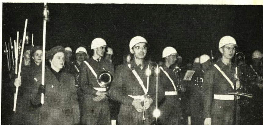
Hjemmeværnet mødte i galla og dannede en smuk ramme om den stilfulde 4. maj-aften ved Helligåndskirken.

Det er vort livs hårde vilkår, at vi, der kun ønsker fred og forsoning, må være forberedt på krig for at undgå den. Sikrer vi freden på denne måde, og lader vi aldrig kravet om de undertrykkes frihed hvile, vil mennesket til slut sejre. Alle diktaturer har deres tid — ønsket om frihed, menneskets ukuelighed, vil bane vejen for tøbrud og vår også i de kommunistiske diktatorers isvinter. I mellemtiden er det vor opgave, samtidig med at vi står på vagt for freden, at levendegøre og udbygge vort demokrati. Den verden, vi lever i, den vestlige, er langt fra fuldkommen endnu. Vi har stadig racehad, intolerance, frygt og nød at kæmpe imod, men vi kan år for år spore fremgang for demokratiets ide, vi er på rette vej, og vi må fortsætte ad den vej. Det skylder vi dem, vi mindes, de utalte millioner, der døde for menneskerettighederne, det skylder vi os selv, og det skylder vi dem, der kommer efter os.