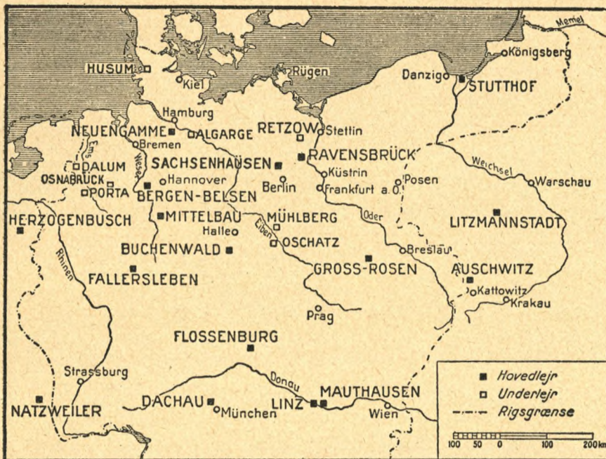
Kortet viser beliggenheden af de fleste hovedlejre og en del kendte underlejre.

Det er en af vore fangekammerater, der skriver til „Pigtråd“ og beder os bringe et kort over de tyske k.-z.-lejre. Her er det.