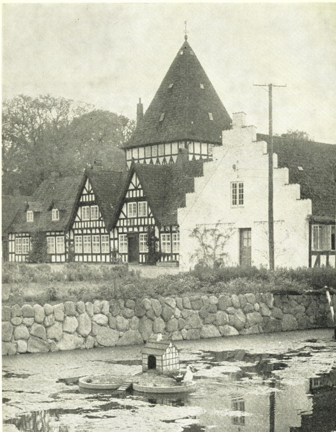
På Risingegaard syd for Kerteminde kan man stadig finde en virkelig smuk, gammel bindingsværksbygning, gennemført i alle detaljer — om det så er gårdens gæs, der holder til i det voldgravlignende gadekær, så har de deres bindingsværkshus.