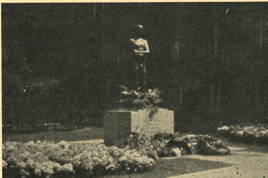
Monument for de faldne fra den 20. juli 1944 i Hitlers krigsministerium i Berlin, hvor greve Stauffenberg blev henrettet — mellem de to vidner i baggrunden.

„Får De ikke besøg af de efter-ladte?“ „De kommer og skriver stadigvæk til mig — attentatsmanden Stauffenberg blev skudt ned i Hitlers krigsministerium i Berlin, hans to sønner myrdedes kort efter — deres hustruer besøgte mig i Plötzensee. Dér traf de sammen med grevinde Matuschka, som havde mistet to sønner under skafottet, begge theologer