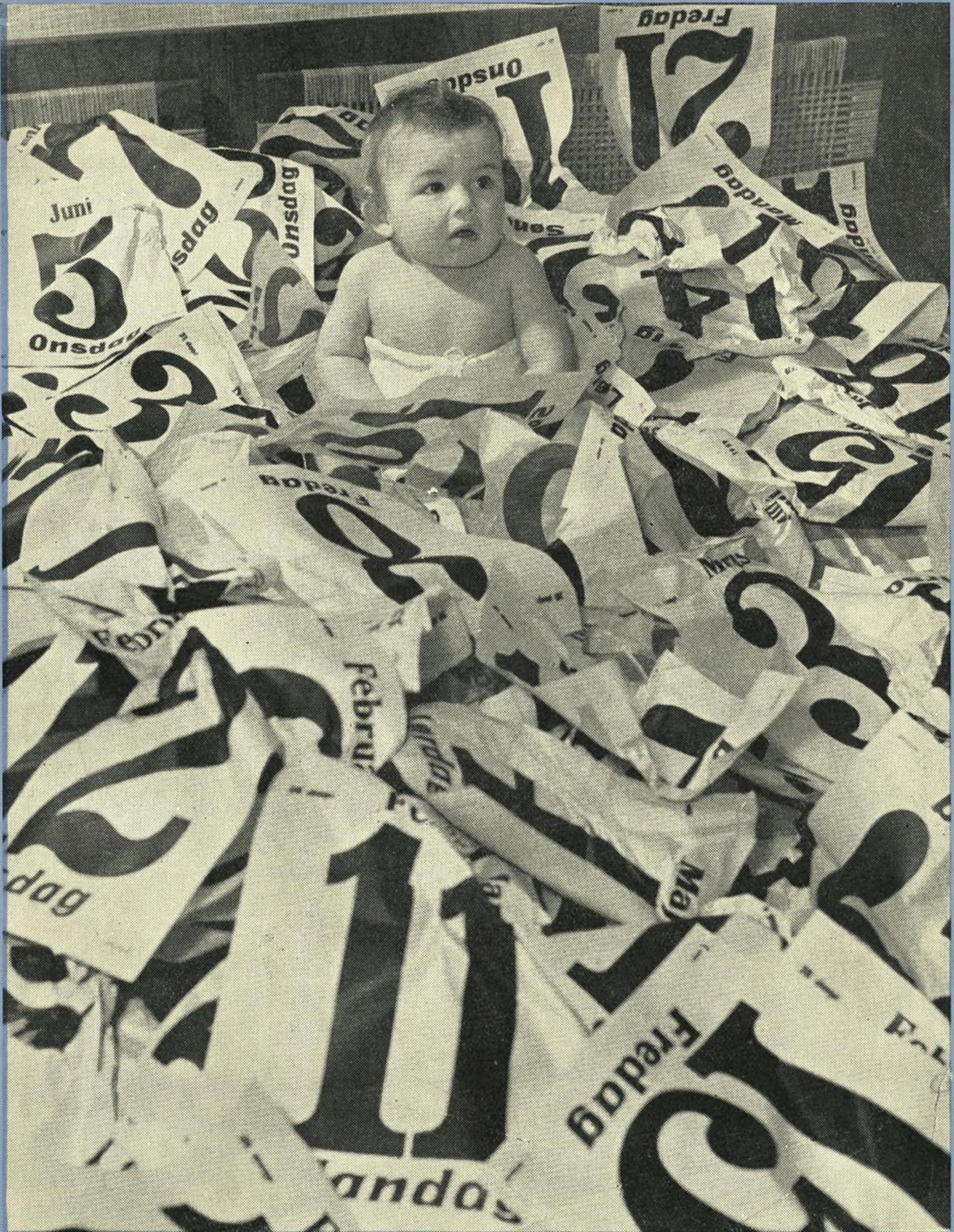
Alle bladene er revet ud af dagbogen for 1959, og vor lille gut afspejler al vor ængstelige forventning til 1960.