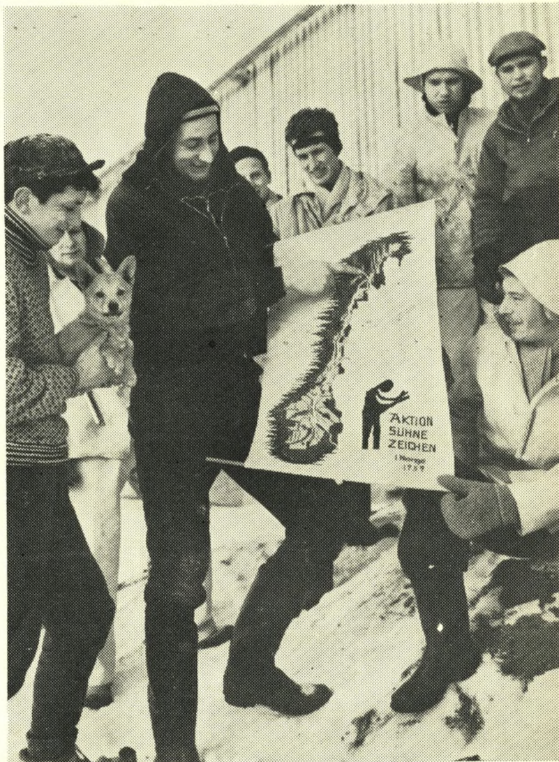
Fædrenes ondskab sones: Som udtryk for tysk kristen ungdoms skyldfølelse for nazismens ondskab hjælper et hold tyske frivillige for tiden Nordnorges åndssvagehjem i Trastad med at bygge en gård, som skal forsyne hjemmet med naturalier. Arbejdet udføres efter et program, vedtaget på et kirkemøde i Leipzig i 1958.