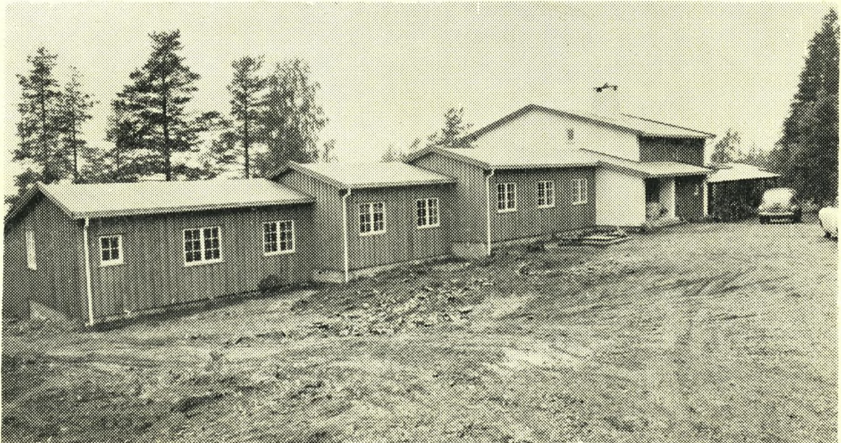
„Solhøgda“ er rejst på en skovkranset åsryg ved Oslofjorden — et løfte blev holdt 15 år efter.

Man regner med 4 ugers ophold. Hjemmet står også åbent for danske kvinder.