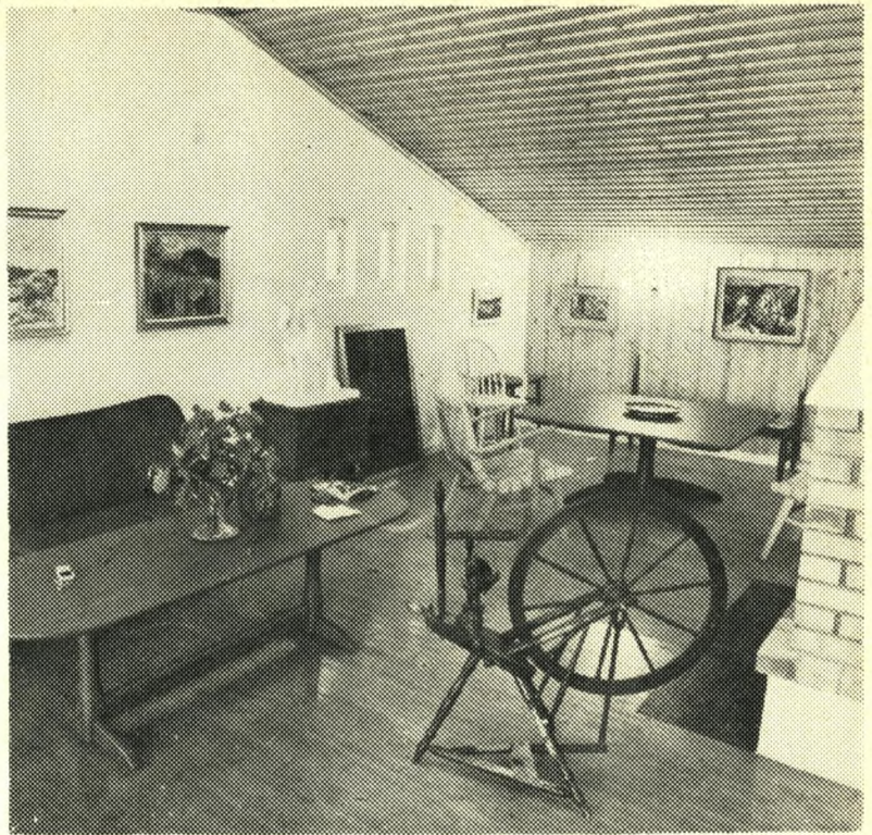
Interiør fra hjemmets store, smukke pejsestue, enkel og hyggelig og smykket med kunstnerens gaver.