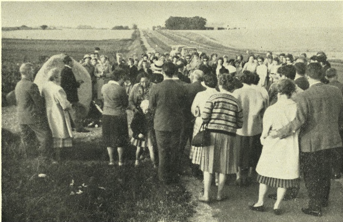
Ved stenens ene side står elever fra Osted Efterskole, ved den anden pårørende og venner til de elleve frihedskæmpere.