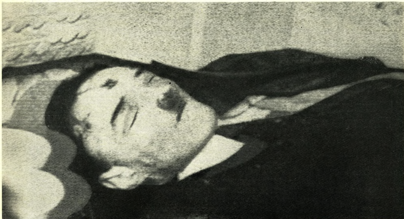
HITLER BEGIK SELVMORD. Russerne hævder, at de har dokumentarisk bevis for, at Hitler begik selvmord ved at skyde sig igennem munden uden for Rigs-kancelli-bunkerens i Berlin. De har frigivet nogle billeder, som findes på filmen „De erobrede Berlin“. Filmen blev taget af fotografen Ivan Panov med Lev Danilov som producent i slutningen af april og de første dage i maj 1945, mens russere og tyskere kæmpede om den tyske hovedstad.

Højeste aldersgrænse for at komme i betragtning ligger omkring 35 år. Den danske forening Norden, Malmøgade 3, København Ø., giver yderligere oplysninger.