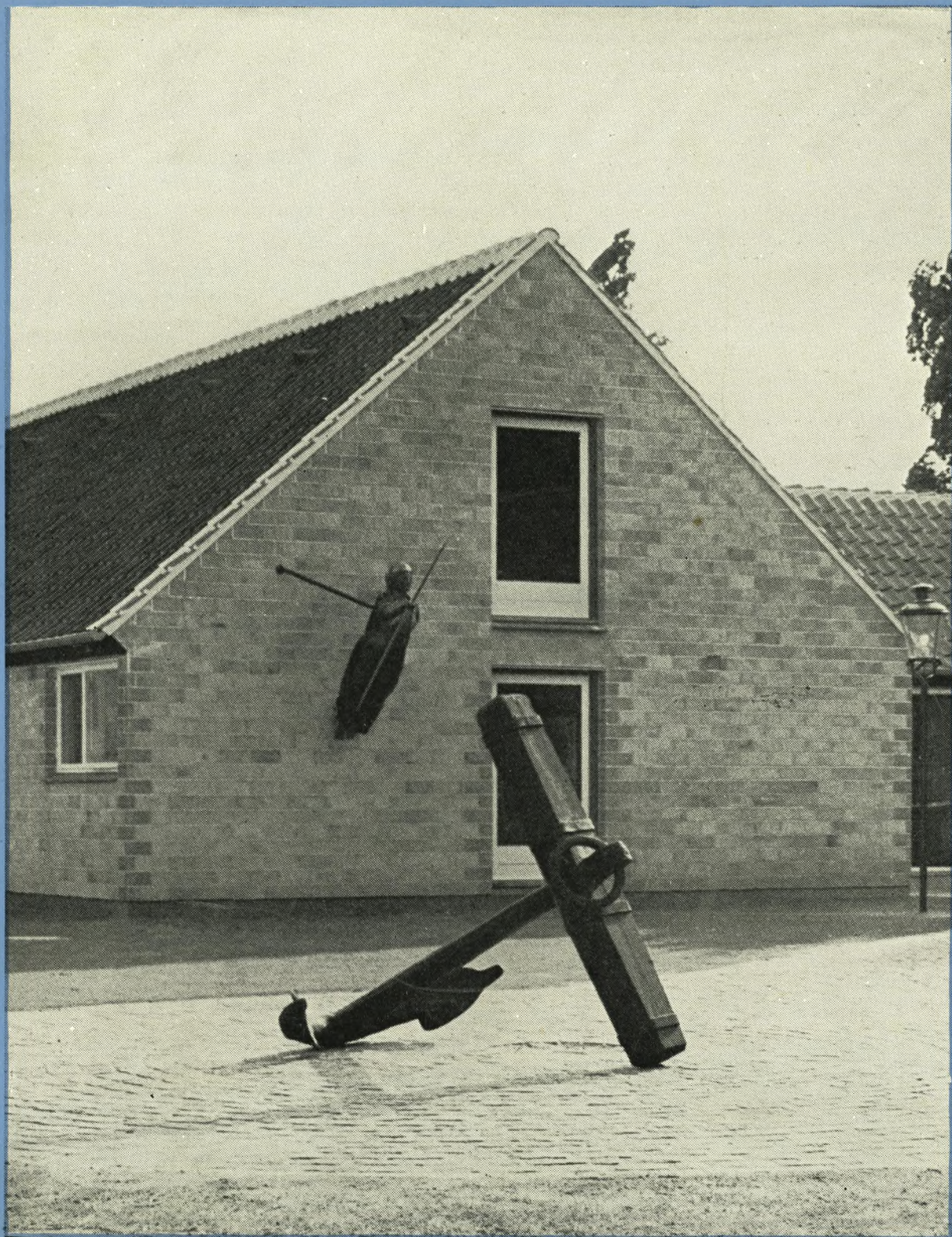
4. Maj-Kollegiet i Marstal er opført af gule murstensblokke og med rødt tag. På gavlen ses gallionsfiguren „Mor Danmark”, strandingsgods fra 1870'erne.