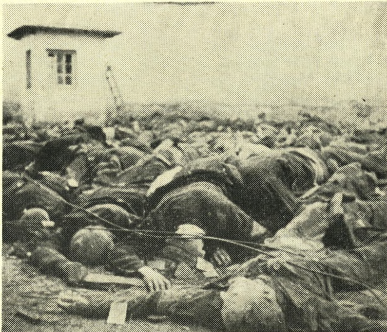
Krigsfanger mejet ned af nazisterne i 1944.