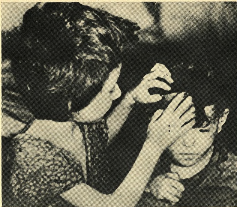
Jødiske børn i ghettoen i Warszawa.

Dette får filmens instruktør til at sige: — Hitler kan aldrig have gjort det hele selv. Der var mange medskyldige i dette drama, som kostede 25—30 millioner mennesker livet.