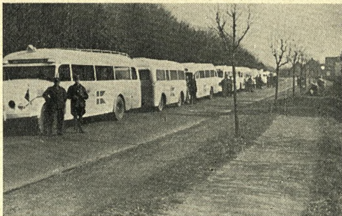
De hvide busser fra Sverige blev en af okkupationsårenes skønneste oplevelser.

anbefales, at man underbygger sine meninger ved citater eller ved kilderne, når de historiske begivenheder skal belyses, medens man selvfølgelig er frit stillet med hensyn til sin egen vurdering heraf.