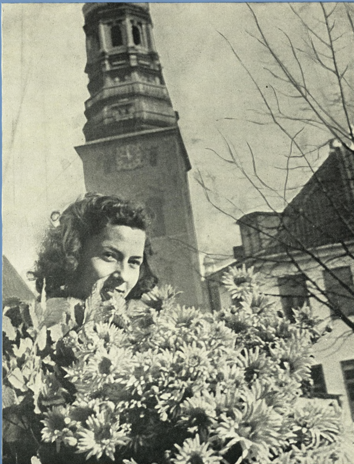
Efteråret er over os, og blomsterelskerne siger det for tiden med krysantemer. Optagelse fra Højbro Plads.