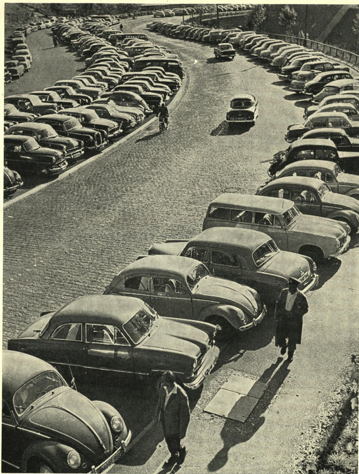
FORARSSOLEN HAR BEGYNDT AT SMILE