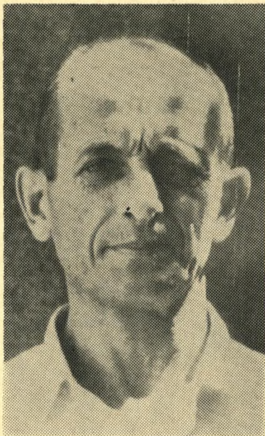
Adolf Eichmann, som han ser ud i dag under interneringen i Israel.

Eichmann, der myrdede 6 millioner jøder, og professor Heyde, der myrdede 80.000