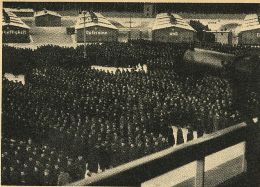
Morgen og aften trådte 26.000 fanger an til appel uden hensyn til sne, kulde og regn. (Originaloptagelse fra lejren).

er registreret i lejren i årene 1939—45, og at 100.000 fandt døden her.