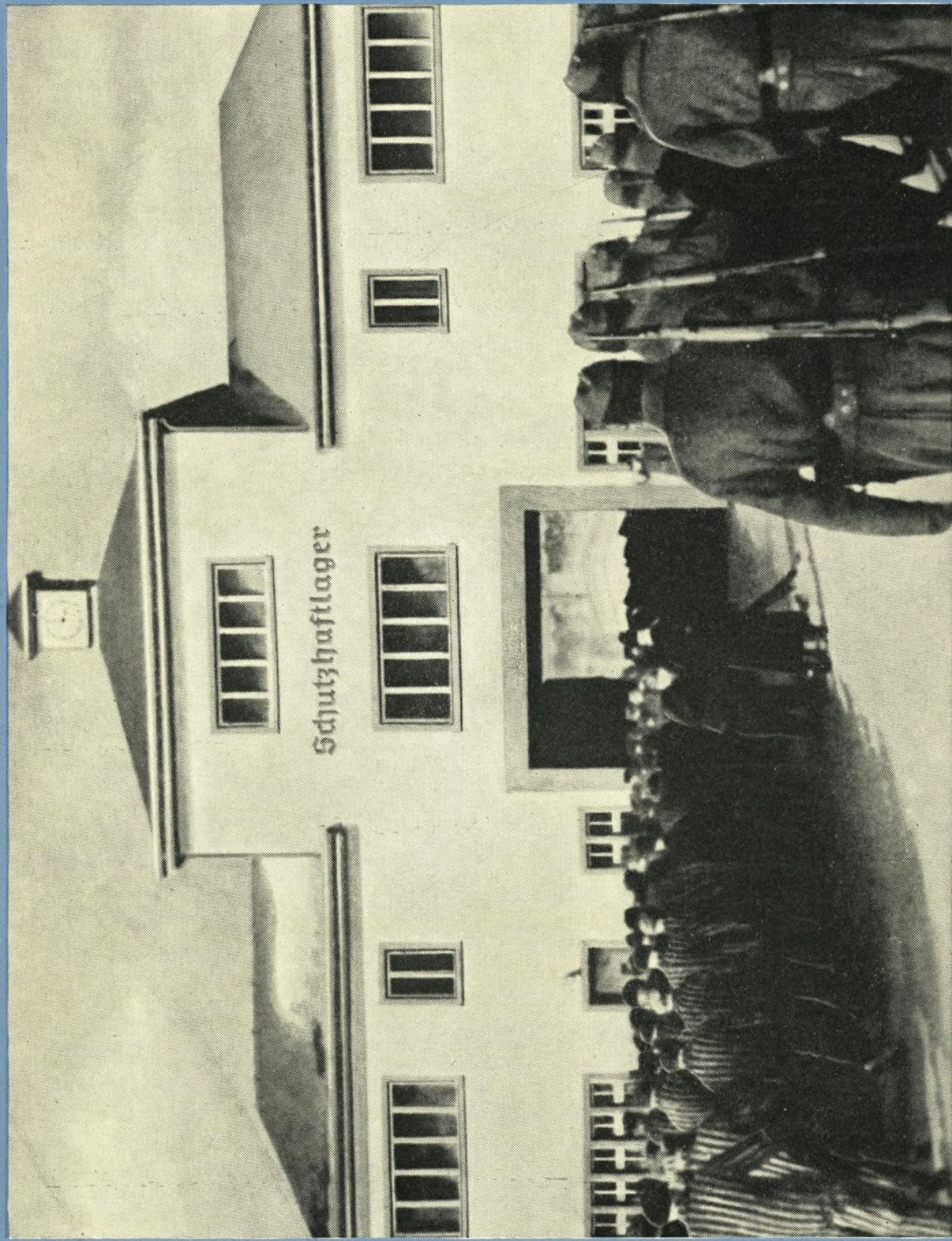
Originaloptagelse fra k-z-lejren Sachsenhausen vinteren 1941—42. Fanger i tyndt, stribet drejlstøj marcherer gennem porten til slavearbejde på SS-fabrikker. Til højre bevæbnede SS-soldater. — Lejren indvies den 23. april til mindepark. Se iøvrigt side 44—45.