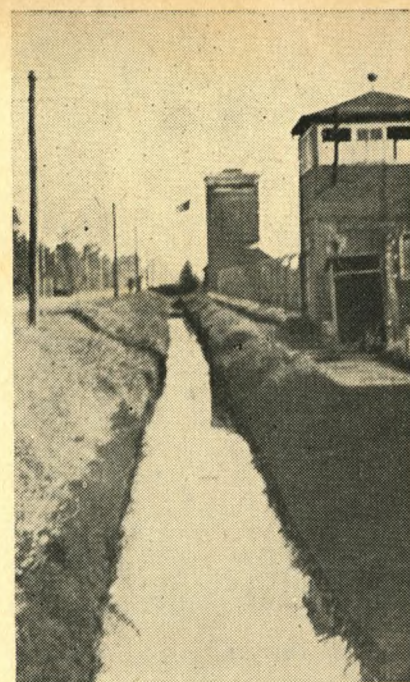
Neuengamme. Det elektriske hegn, vagttårne med maskingeværer og grøfter holdt 11.000 fanger i skak.

Og de danske og norske fanger optog forbindelsen i den rette ånd. De gav af deres pakker og deres lejrportioner, bl. a.