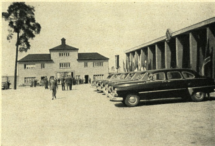
Fra k-z-lejren Sachsenhausen ved Berlin. Lige for: Den oprindelige bygning for en del af vagtmanskabet og porten ind til lejren. Til højre: Det internationale museum for modstandsvægelsen i Europas lande.

Under mit tredje besøg i mindeparken i Sachsenhausen iagttog jeg en flok skolebørn, der var på besøg. Det var så tydeligt, at de var stærkt gre-