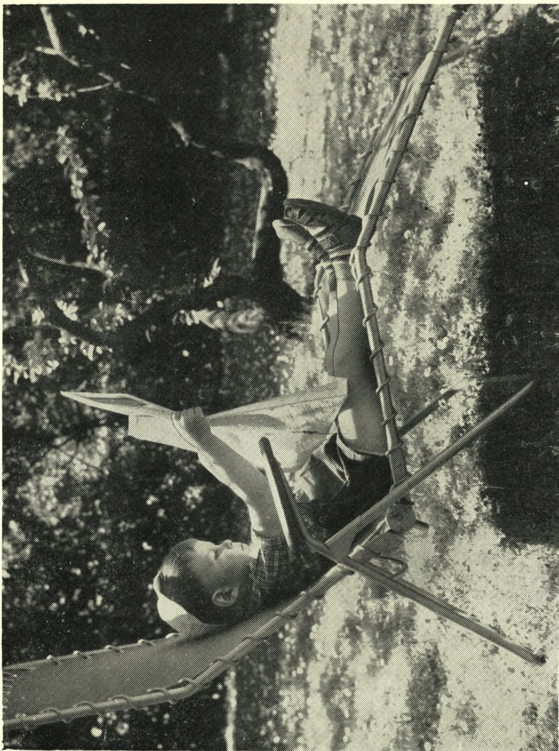
Han er ikke blot charmerende — han er også et stykke fremtid, der er levende interesseret i nutiden.