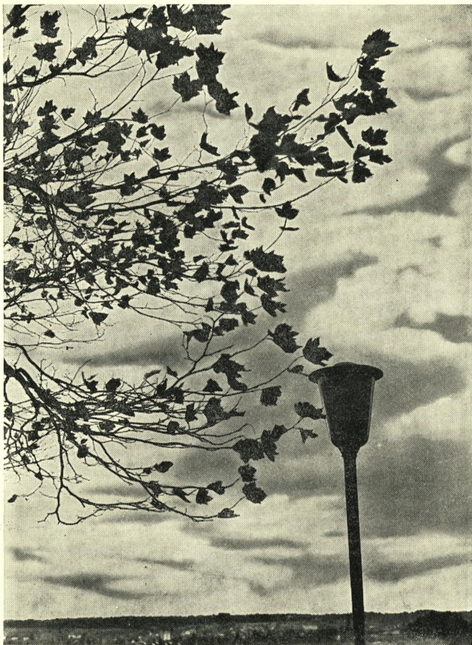
Efteråret varsler vinteren.