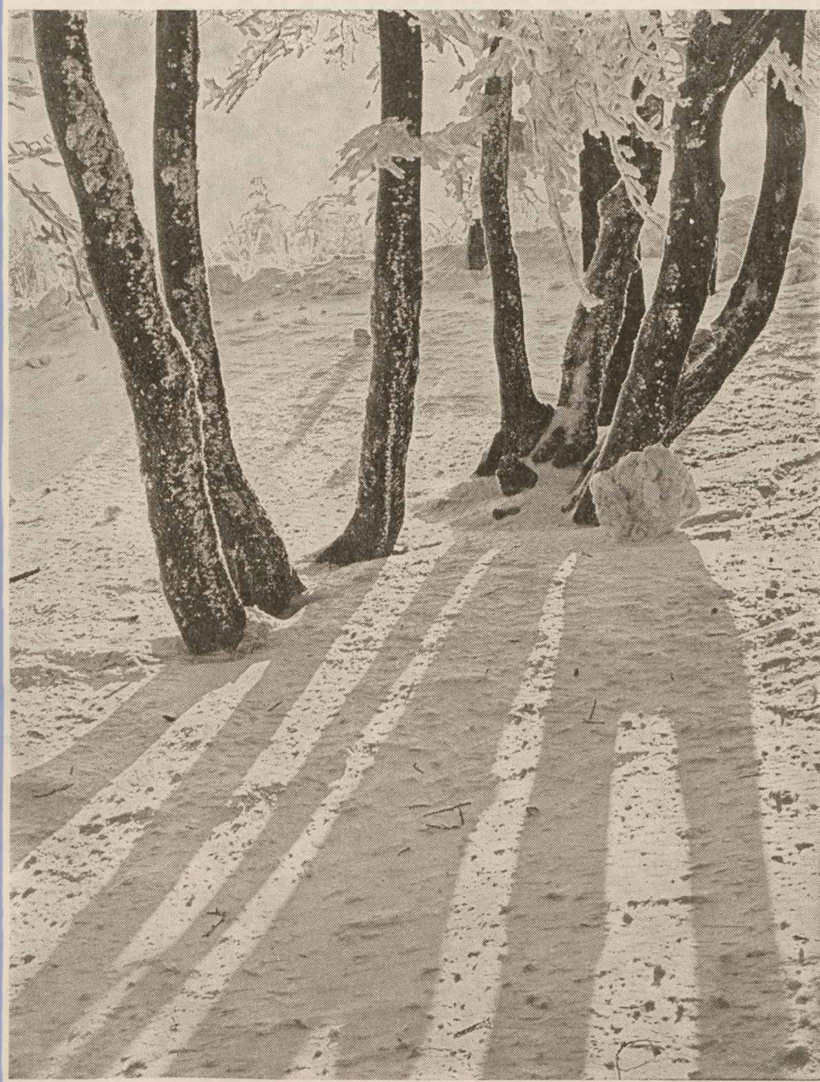
Det fine lag sne ved årsskiftet skabte megen vinterskønhed i det danske landskab.