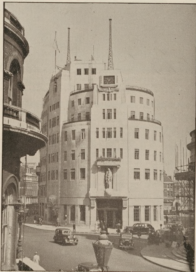
BBC's hus i London, huset der spillede så stor en rolle for de danske i England — og for os herhjemme.

— Man kan sige, at der var to hovedstrømninger blandt danskerne i London: Den ene retning havde den