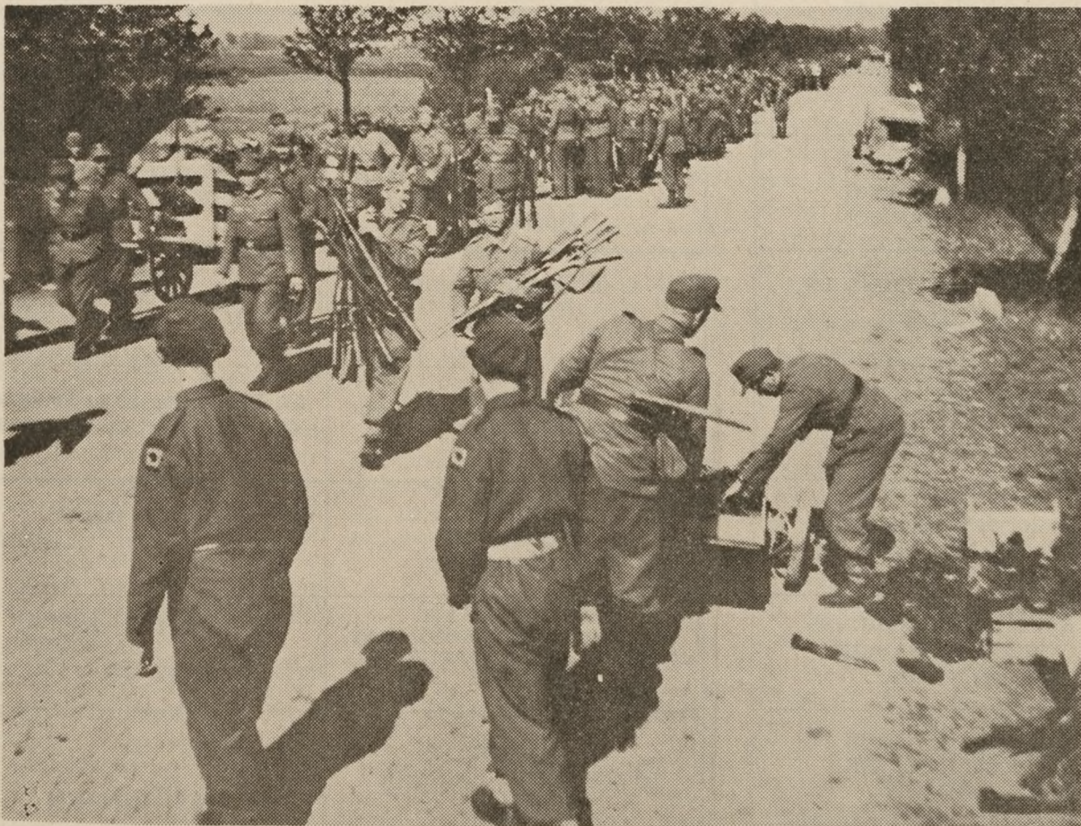
Efter den 5. maj strakte kolonner af besejrede tyske soldater sig ned gennem Sønderjylland. Nogle af kolonnerne var mere end 30 km lange, som f.eks. denne, der er fotograferet på vejen fra Tønder til grænseovergangen ved Sød. Desillusionerede, trætte, slagne afleverede de tyske soldater deres våben til brigadesoldaterne, modstandsfolkene og englænderne ved grænsen. Våbnene kastede de uden større sorg, men de gjorde vrøvl, når de skulle af med de levnedsmiddelpakker, de havde taget med fra Danmark.

En dag sad min søster i en lastvogn og kom vist ved et uheld til at træde på selvstarteren, så at vognen, der stod i gear, gav et ryk fremad. En tysk soldat, der havde siddet på bagsmækken, hvor han fortærede sin knapt tilmålte middagsration, faldt og nåede ikke at redde sin mad. Skyndsomst flygtede min søster hur-