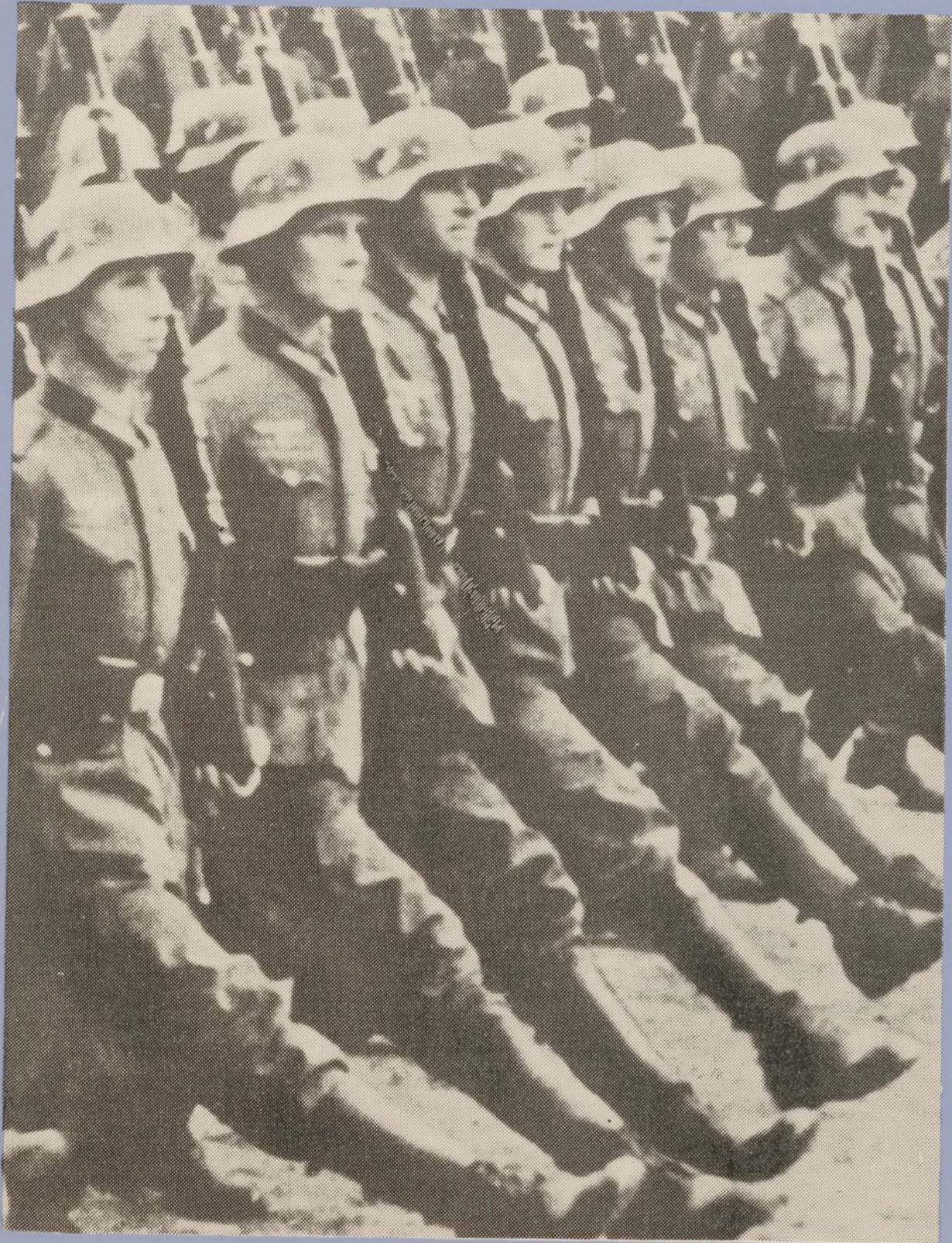
De fremmede trampede ind over vor grænse den 9. april 1940. De trampede ikke blot i brolægningen, men også på alle, der kom dem i vejen.