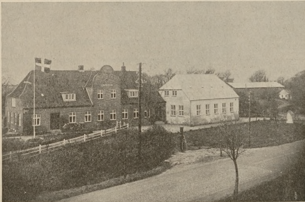
Det danske forsamlingshus „Abild Landbohjem“ ved grænsen, fire kilometer nord for Tønder. Stedet var i foråret 1945 hovedkvarter i et tysk forsyningsområde, som i tiden omkring den 5. maj blev et sandt kaos.

Men i særdeleshed kan jeg ikke glemme det eventyr, et sandt eventyr, som vi drenge oplevede det midt i al den kaos, som blev fuldstændig i ugerne frem mod den 5. maj og en god tid derefter, idet der i Abild var et overflødhorn af materiel, hørende til krigsmagten, som enhver