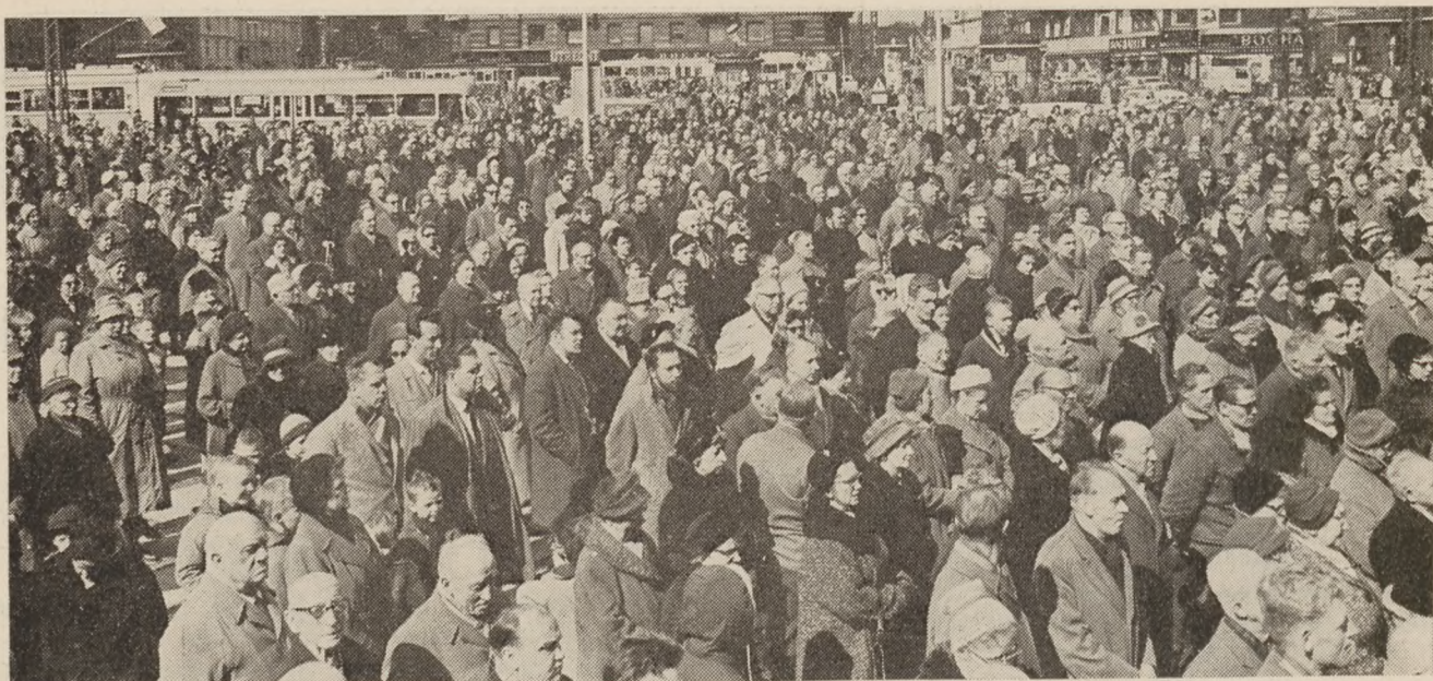
Den 9. april 1962 standsede tusinder op på Rådhuspladsen i København for ligesom under okkupationsårene en stund at lade tankerne gå tilbage til Danmarks skæbnedag for nu 22 år siden. Da rådhusuret slog 12, blottedes alle hoveder, sporgvognene og al anden trafik standsede, og der var kun fårnuret at høre på den mægtige plads. Billedet viser et udsnit af den store skare, som arrangementet samlede.

Få dage senere blev han sat fra den bestilling, han så dygtigt og loyalt havde varetaget siden 1906. Dag efter dag blev den danske redaktør i Flensborg skygget af Gestapofolk, og det var forbudt for ham at sætte sin fod i bladets ejendom.