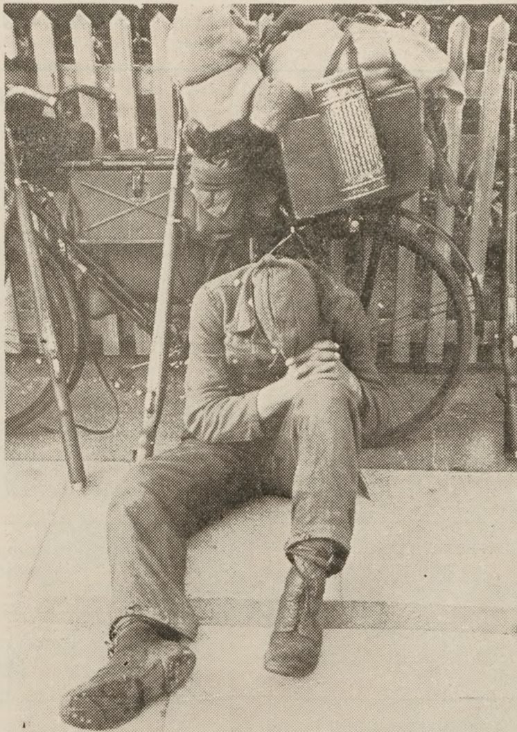
De tyske soldater forblev i kasernerne den historiske nat mellem den 4. og 5. maj 1945. Men allerede om morgenen tiltrådte de første afdelinger tilbage-toget. Endeløse kolonner marcherede fra København ad hovedvej nr. 1 til Korsør, hvor DSB's færger ydede dem den sidste fribefordring på dansk grund. Her er en enhed af værnemagten under et hvil sunket sammen i fortvivelse. Fodret med nazistiske floskler fra skoledagene og senere i Hitlerjugend om sit fædrelands uovervindelig og om de tyske overmennesker sidder han her ved en sjællandsk vej — og kan ikke finde ud af det.

Faren ved at afbrække projektilet af en patron er jeg ikke i stand til at bedømme, men skal blot tilføje, at det blev gjort i tusindvis af gange.