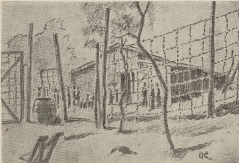
„Lusebarakken“ ved Elvenes, hvor 400 af lærerne var indkvarteret.

Lærernes kall er imidlertid ikke bare å gi barna kunnskaper. De skal også lære dem å tro og ville det som er sant og rett. Derfor kan de ikke uten å svikte sitt kall lære noe som strider mot deres samvittighet. Den som det gjør, øver synd både mot de elever han skal lede og mot seg selv. Dette lover jeg dere at jeg ikke skal gjøre. Jeg vil ikke oppfordre dere til noe, som jeg mener er uriktig, eller lære dere noe som etter mitt syn ikke stemmer med sannheten. Jeg vil, som jeg hittil har gjort, la min samvittighet være min rettesnor, og da tror jeg at jeg vil være i pakt med det store flertall av det folk som har gitt meg oppdragergjeringen.