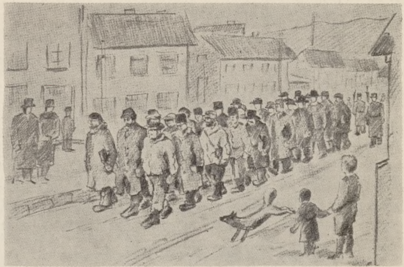
17. maj 1942: Lærerne på vej til tvangsarbejde. Det mærkeligste 17. maj-optog, der har gået gennem gaderne i Kirkenes.

— Nazificeringsanslaget mod den norske skole slog fejl; men først sent på efteråret slap lærerne fri. Da var undervisningen i skolerne atter for længst i gang. Den 7. april begyndte