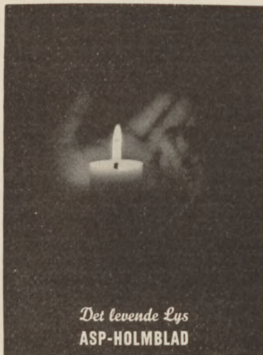
Det levende Lys ASP-HOLMBLAD