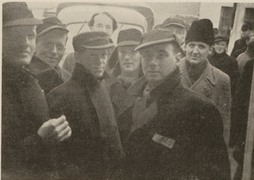
Neuengammefanger i lejren umiddelbart før hjemsendelsen med de hvide busser.