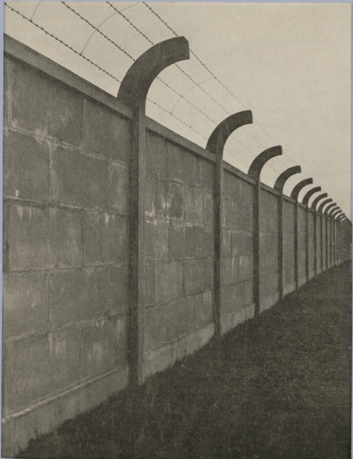
Mur med pigtråd omkring koncentrationslejr. Læs iøvrigt artiklen side 144.