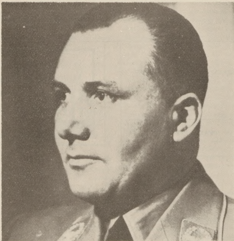
Martin Bormann — Hitlers stedfortræder — i en lidt mere fedladet tilstand end den, hvori de fleste fotografier viser ham.

Det mærkelige ved Martin Bormann er, at ingen af nazismens slyngler havde eet eneste godt ord at sige om ham. Såvel under Nürnbergprocessen — som i en række andre tilsvarende processer, hvor k-z-lejrche-