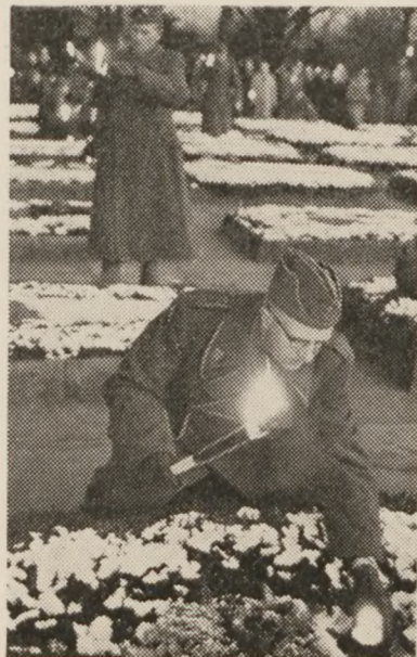
På gravene tændtes levende lys.

Ryvangen er stedet, hvor 288 danskere hviler eller mindes ved navneplader. De gav hver især deres liv i kamp. De er vore kammerater. De faldt, og een og anden vil tilføje: Altså tabte de, men vi svarer: Nej, vore kammerater vandt. De sejrede. Deres sår var nok personligt død-