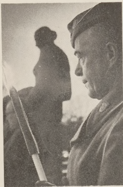
Højtid i fakkelskær.

bringende, men livgivende for de idealer, de kæmpede for og gav den største indsats for, som et menneske kan give, nemlig sit eget liv. De faldt, men deres idealer sejrede. En dag slog frihedsklokken, og sejrens dag var inde.