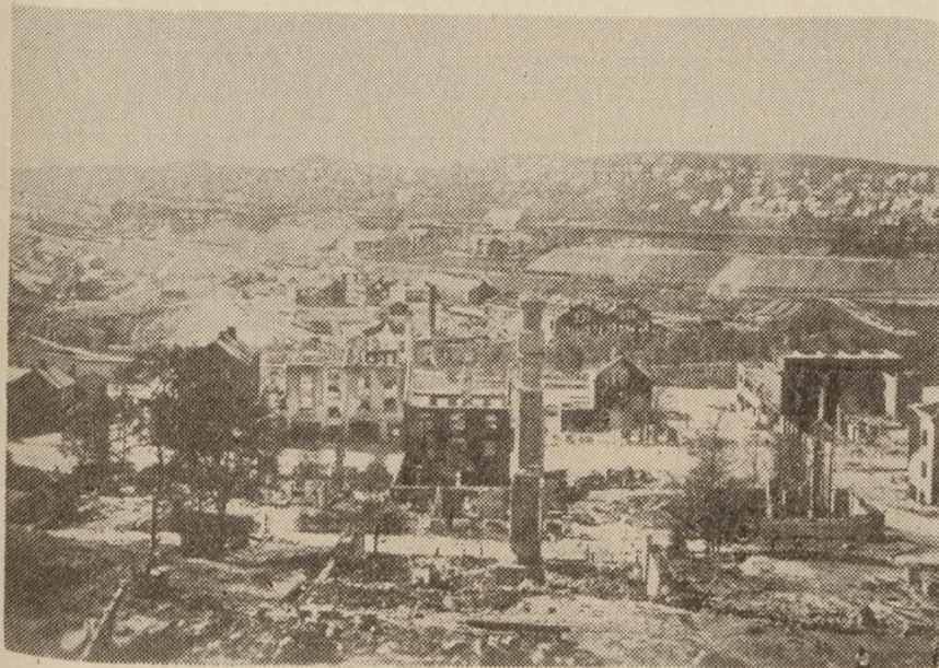
Narvik, som tyskerne efterlod byen.