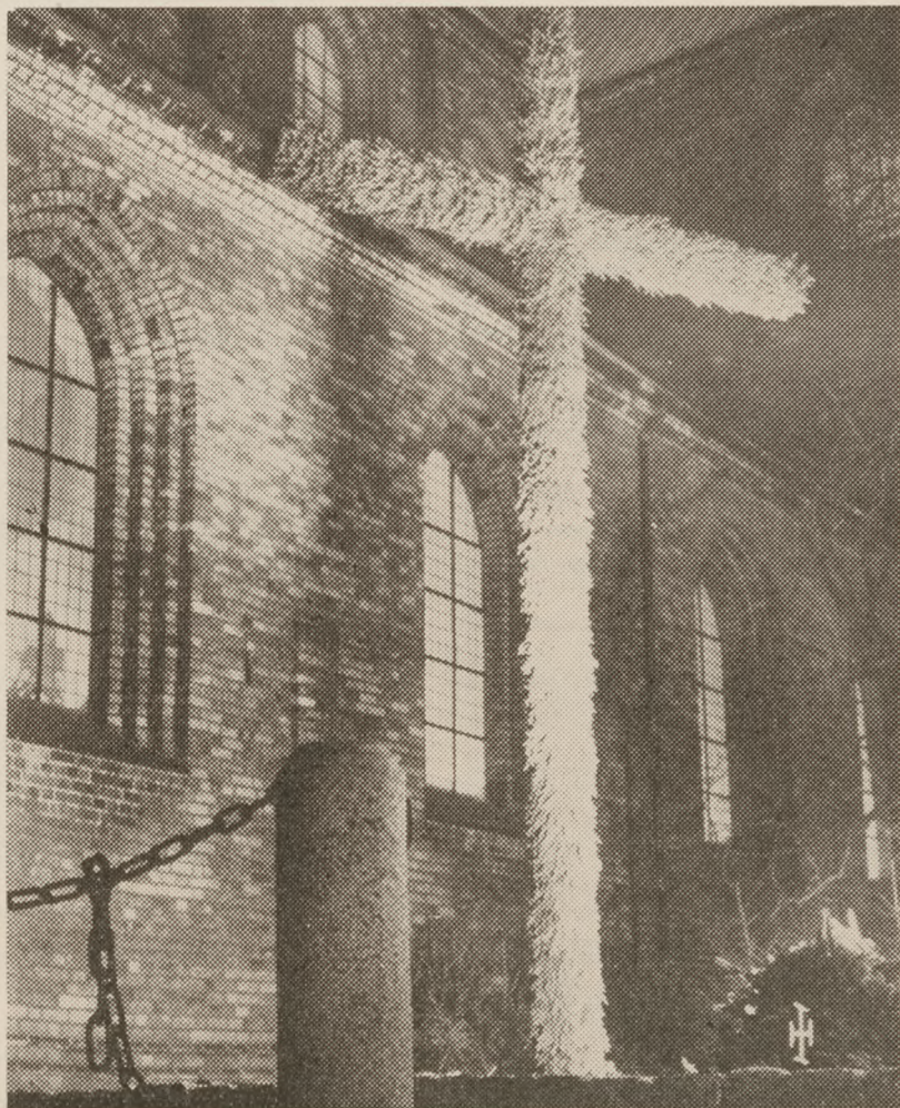
Dagen før juleaften var der for første gang i år tændt lys ved mindekorset for de faldne foran Aarhus Domkirke. Juleaften kommer der levende kerteys til.