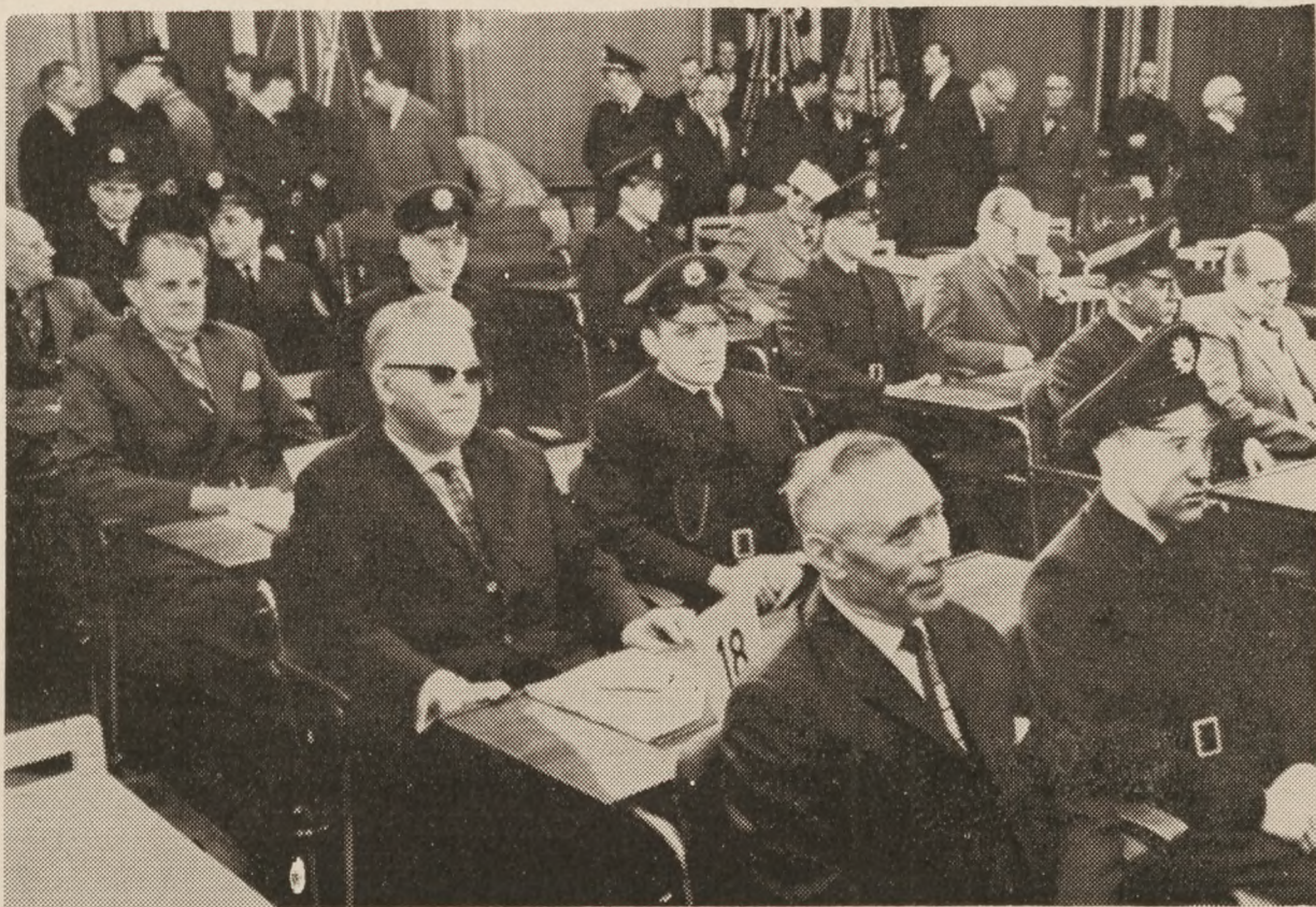
I Frankfurt indledtes den 20. december den hidtil største tyske proces om krigsforbrydelser. Her ses en del af de 21 anklagede i Auschwitz-processen. Ved siden af hver anklaget sidder en retsbetjent.