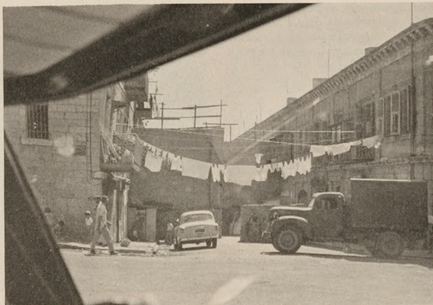
En høj cementmur deler Jerusalem i to dele, en israelsk og en jordansk. Konerne viser ikke muren særlig ærbødighed, og pladsen op mod den må tjene som tørreplads efter storvasken.

Det kan i denne forbindelse nævnes, at det store kobberværk ved Kong Salomons miner ved Det røde Hav er anlagt for erstatningsbeløb fra Vesttyskland. Værket hjembringer i dag megen fremmed valuta.