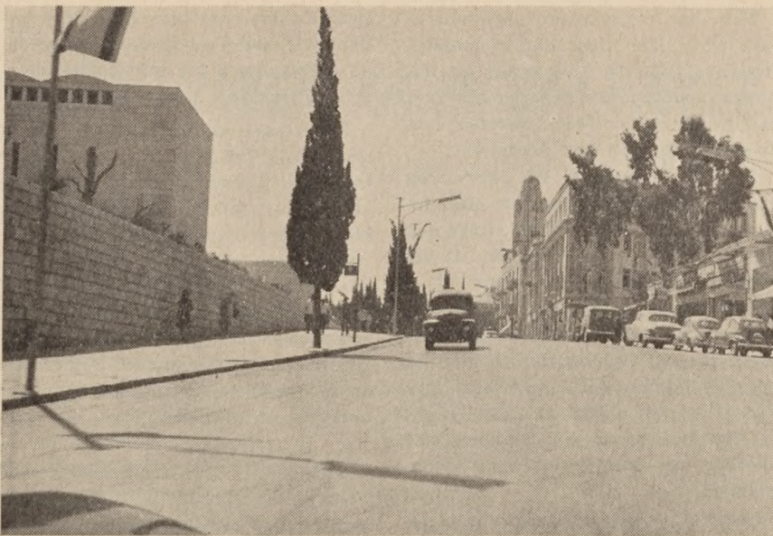
På en af hovedgaderne i Jerusalem rejser det amerikanske KFUM's statelige bygning sig med mødesale, tårn og elegante hotelværelser.

Til højre for os hæver et højt tårn sig med tilhørende bygning. Det er det amerikanske KFUM, der her har rejst et moderne, monumentalt mødehus og hotel. Ikke langt derfra ligger „King David“, hotellet, der på vore besøgsdage flagede med Dannebrog, fordi den danske kirkeminister var gæst der.