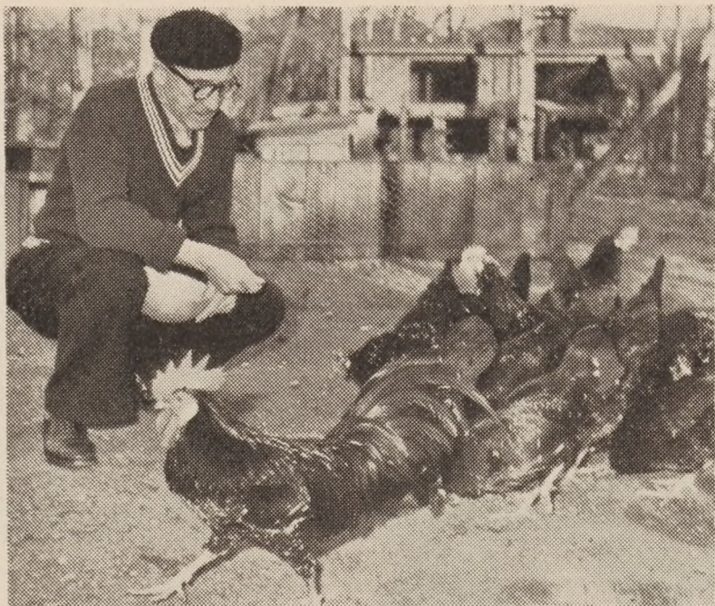
De første år efter at politikommissæren havde taget sin afsked, levede og åndede han for sine præmiehøns. Nu er hønsegården blevet ridebane.