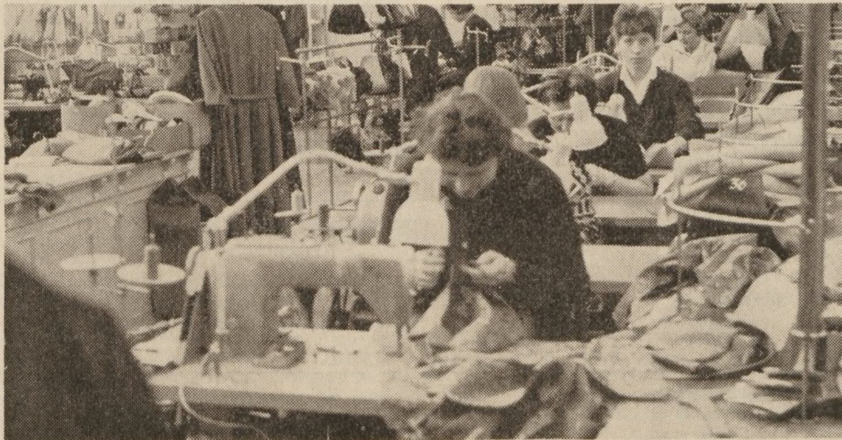
Fra en beskeden begyndelse i Toldstrups hjem er virksomheden vokset til at være en moderne fabrik med 80 ansatte.

Jeg købte synåle, mængder af bånd, der blev til persienne-snore og stropper til dameundertøj, stoffer og et stort parti garn i en beskidt brun farve. Det sidste kom for resten aldrig hjem. En tidligere importør fik væltet indkøbstilladelsen. Stofferne måtte jeg kun tjene 20 pct. på, men bortset fra det, var de handlende helt vænnet fra at se stoffer. De nærmest