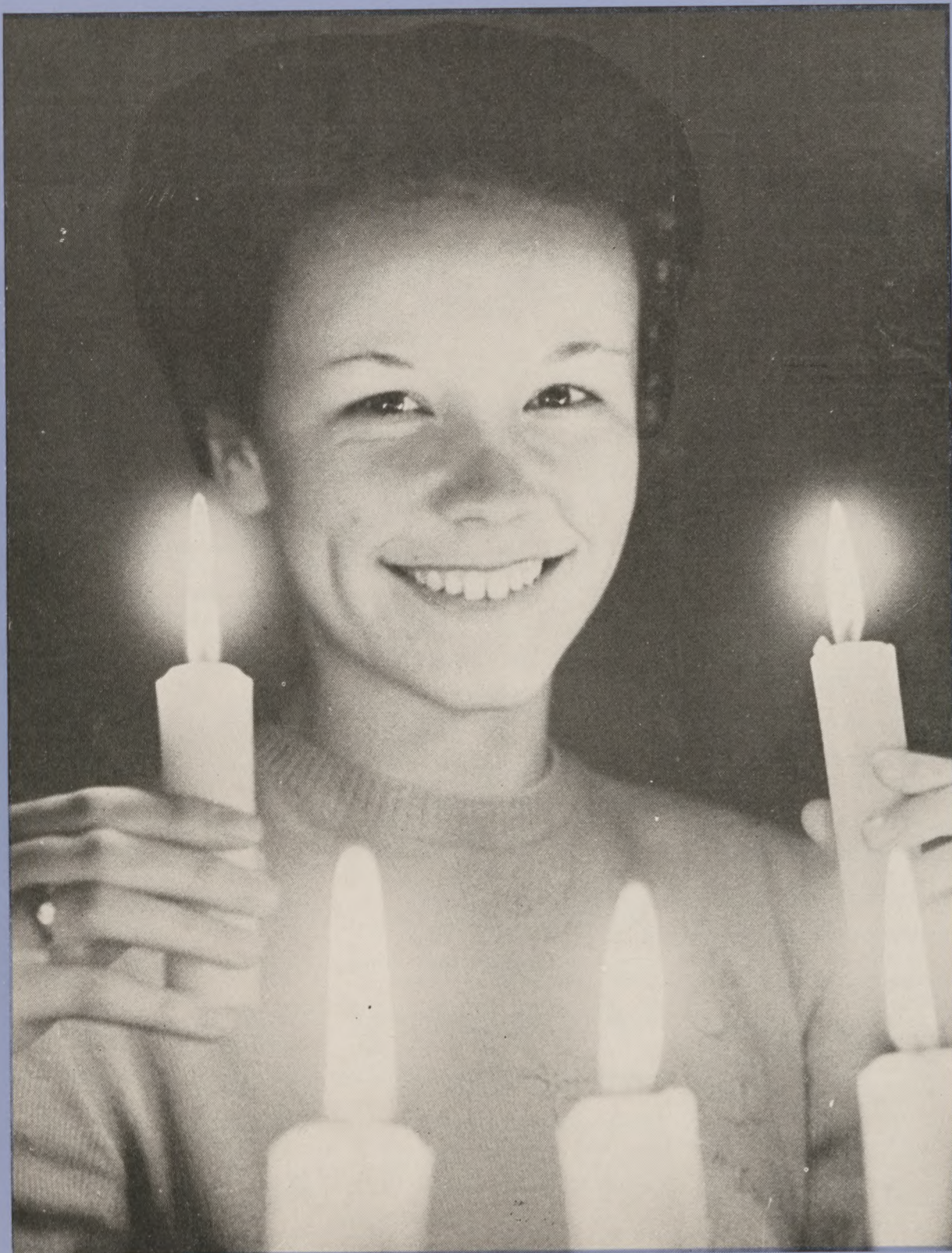
Vi bringer dette billede fra 4. maj-dagen for at minde om, at alle bør tænde lysene den aften. Vi har her en enestående rig tradition, som vi bør værne om.