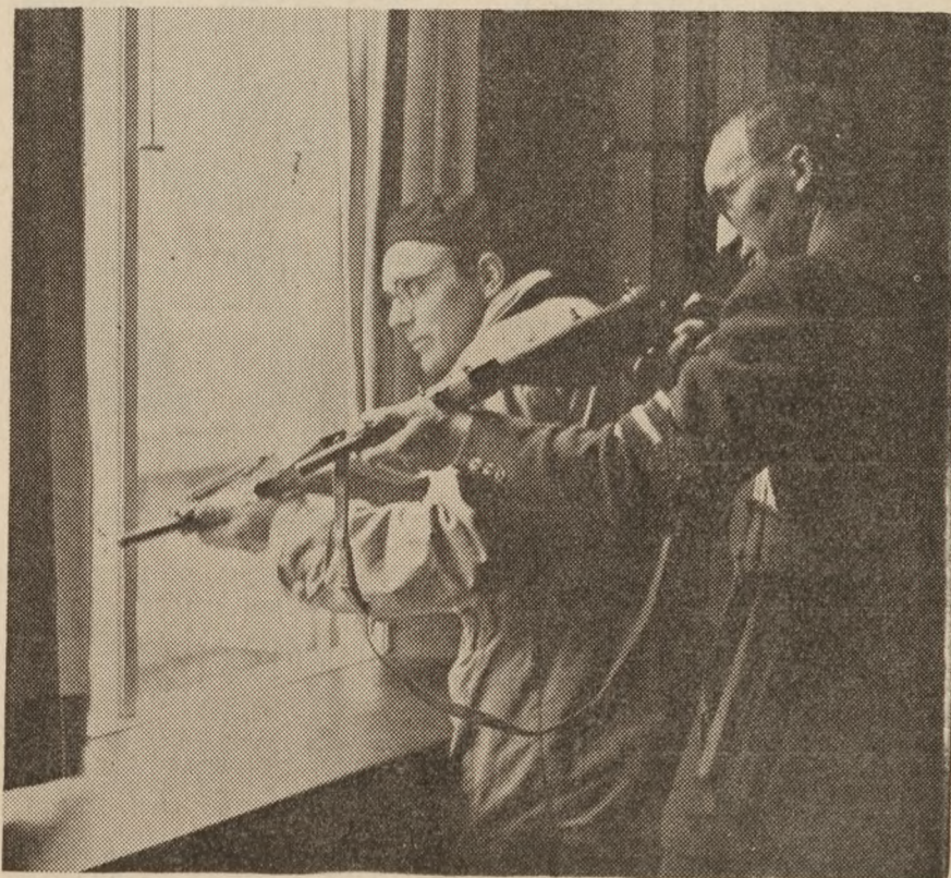
Fra Aarhus Stiftstidendes kontorer beskød man hipoerne.

Ved middagstid måtte jeg til Odder med en ekstra forsyning aviser. Det blev en uforglemmelig køretur. Solen strålede fra en skyfri himmel, markerne var med et blevet grønne, og der var et friskt vårskår over skovene, og i småbyerne på vejen, Beder og Malling, var der flag og fest ved hvert hus, ligesom flagene blafrede fra egnens gårde. Det var herligt at ånde frit igen.