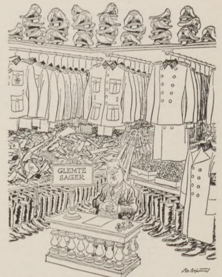
En opinionsundersøgelse har vist, at tyskerne er ved at være trætte af krigsforbryderprocesserne og helst vil glemme os.

Politiken for 10. april bragte denne talende Bo Bojesens tegning af situationen i dagens Tyskland.