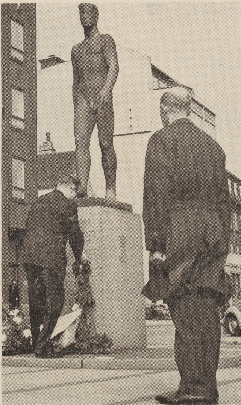
— I vor glæde over befrielsen må vi ikke glemme de mange, der satte livet til på havet for Danmarks sag, sagde formanden for Aarhus Marineforening, der her ses i færd med at lægge en krans ved monumentet for omkomne søfolk på Europaplads i Aarhus.

Århus Pigegarde marcherede gennem byen med fakler og musik og sluttede med en parade ved Christian X's statue på Bispetorv. Mange del-