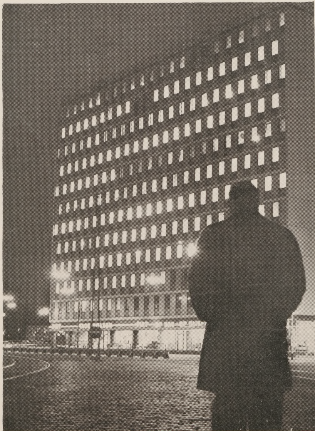
4. MAJ: Lysene strålede fra vinduerne i by og på land Jylland over. Her ses en kontorbygning ved Aarhus havn.