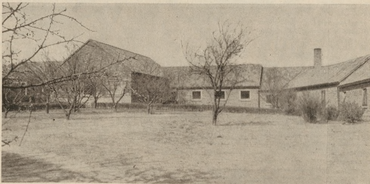
Fjerde Maj-Kollegiet i Aarhus er bygget som en lavlænget dansk bondegård, med fire længer omsluttende en grønnegård.

I et hus, der rummer så mange, opstår naturnødvendigt af og til problemer. Når jeg står for at skulle træffe afgørelse i en eller anden retning, spørger jeg altid mig selv: hvordan ville modstandsfolk se på