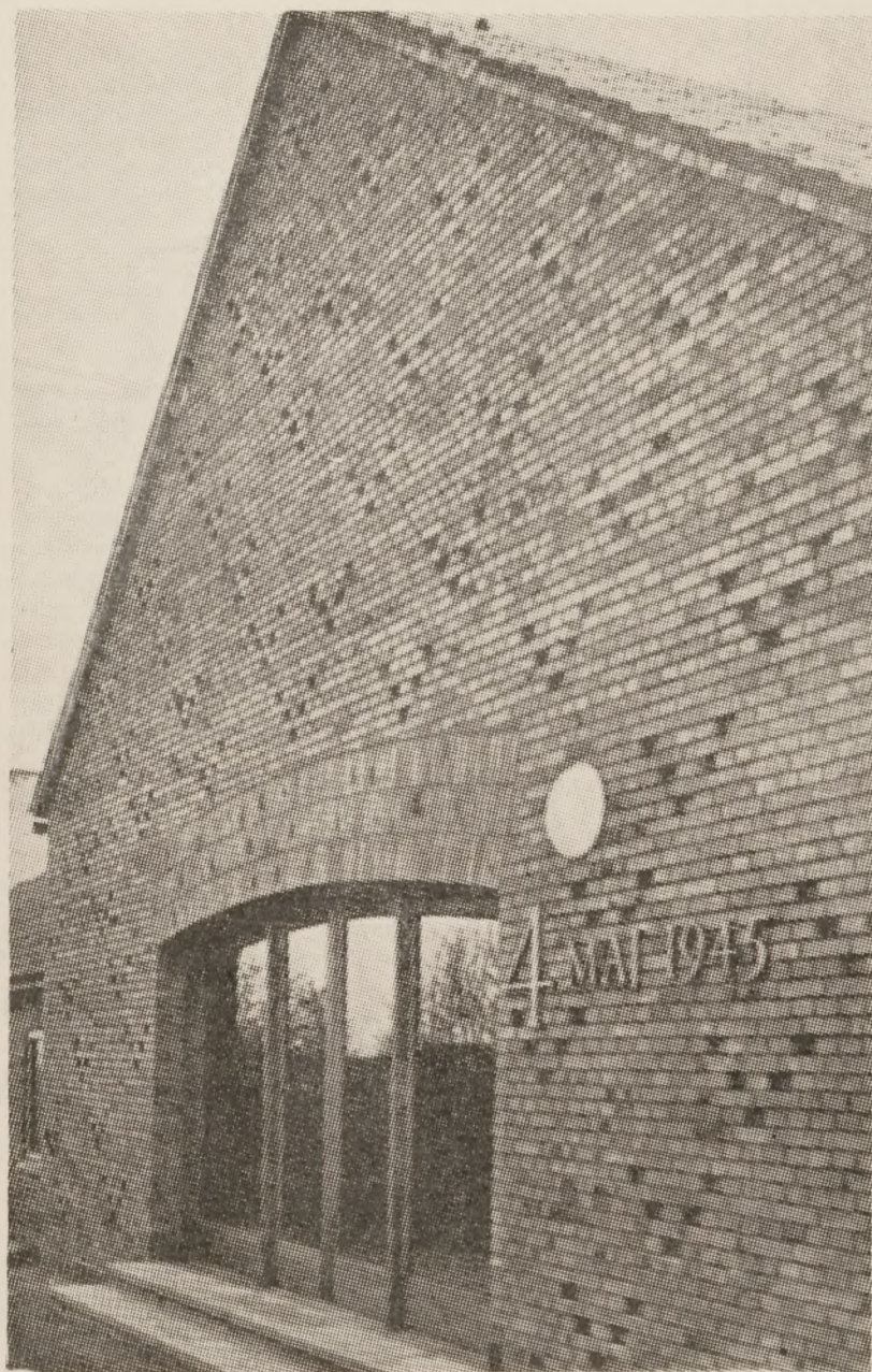
Indgangen til 4. Maj-Kollegiet i Aarhus.