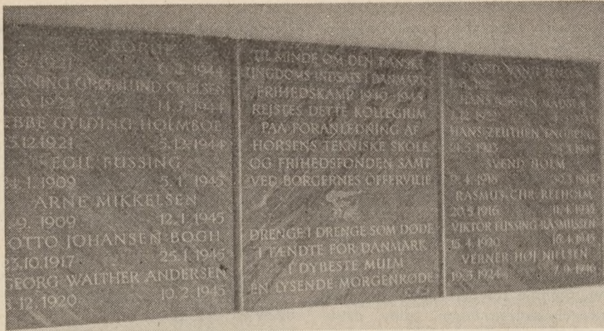
Mindetavlen over de 18 fra Horsens, som døde i frihedskampen.