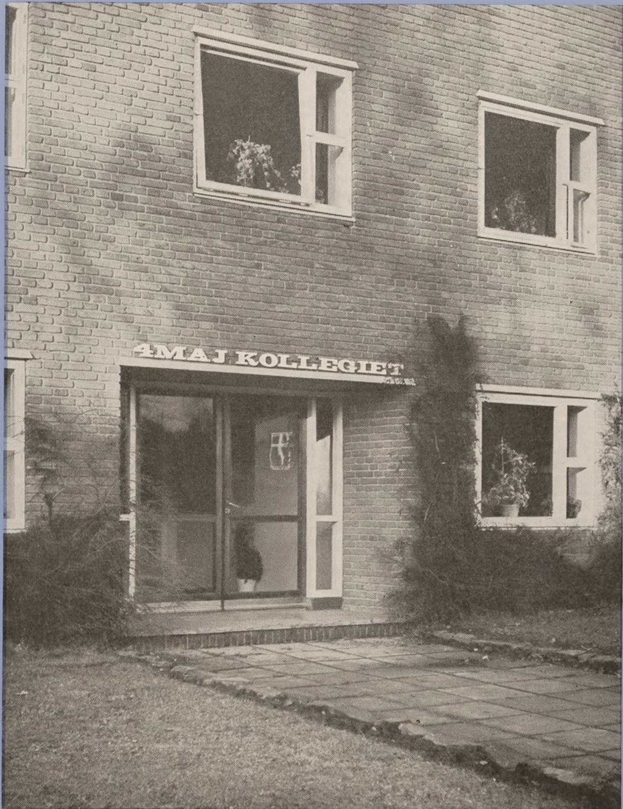
4. maj-kollegiet i Horsens er Danmarks første. Det rummer 40 kollegieværelser for unge under uddannelse.