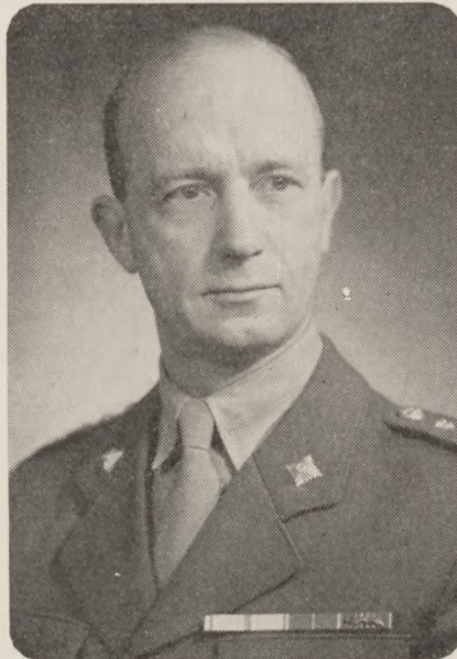
General Fl. B. Larsen.

Jyllands-Postens medarbejder skriver fra X-by i Holsten til bladet for 14. oktober om den store Nato-øvelse.