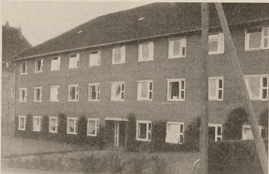
4. maj kollegiet i Horsens. Den store bygning er holdt i rolige, danske linjer.

Der findes også en „Sammenslutning af 4. maj kollegiets venner“, som består af folk, der af en eller anden årsag interesserer sig for kollegiets ve og vel, samt af fhv. kollegianere. Foreningen skaffer en del midler. Man har f. eks. bekostet et fjernsyn, et nyt Dannebrog, tilskud til Sct. Hans-turen m. m.