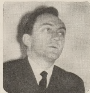
Sølvhøj: Naboskabet er ikke en fjendtlig barriere.

LÜBECK. „Det tysk-danske naboskab må ikke betragtes som en fjendtlig barriere, men som en frugtbringende mulighed,“ erklærede kulturminister Hans Sølvhøj i dag i en tale ved en mindehøjtidelighed for den tyske modstandsmænd Julius Leber i Lübeck. — Leber, der var født i Alsace i 1891, var i mange år redaktør for et socialdemokratisk dagblad i Lübeck og medlem af den tyske rigsdag. Han blev i januar 1945 henrettet af nazisterne.