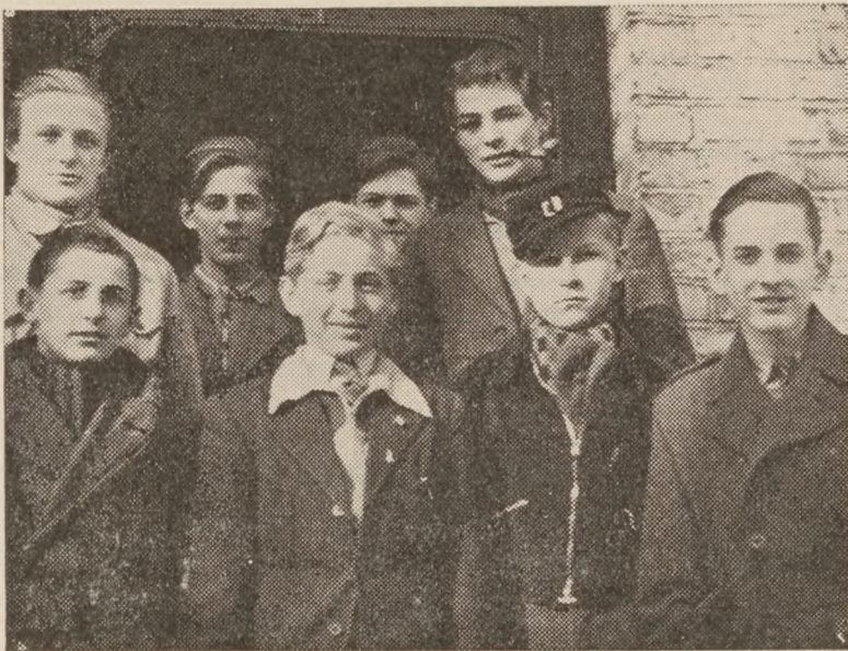
Churchill-Klubben bestod af en lille flok, og det var blot store drenge, men ved deres uforfærdede handling kom de til at skrive Danmarks-historie.

tionen og fra fængselet, og det er enestående i hele verden. De savede fængselscellens tremmer over og listede sig ud om natten, lavede sabotage og vendte tilbage til cellen. En skønne dag gik det galt, og de fik strenge straffe til afsoning i Nyborg Statsfængsel.