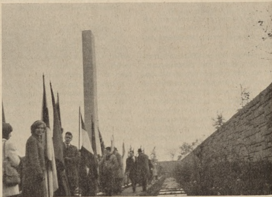
Mange grupper og foreninger var mødt frem med faner, der tog opstilling, da monumentet i Neuengamme blev indviet.

I løbet af lørdag den 6. november kom næsten 600 deltagere fra Danmark. Trods det store fremmøde og så fra andre lande, fra Frankrig mødte således 650, fra Holland 220 o.s.v., var det lykkedes den danske Neuen-