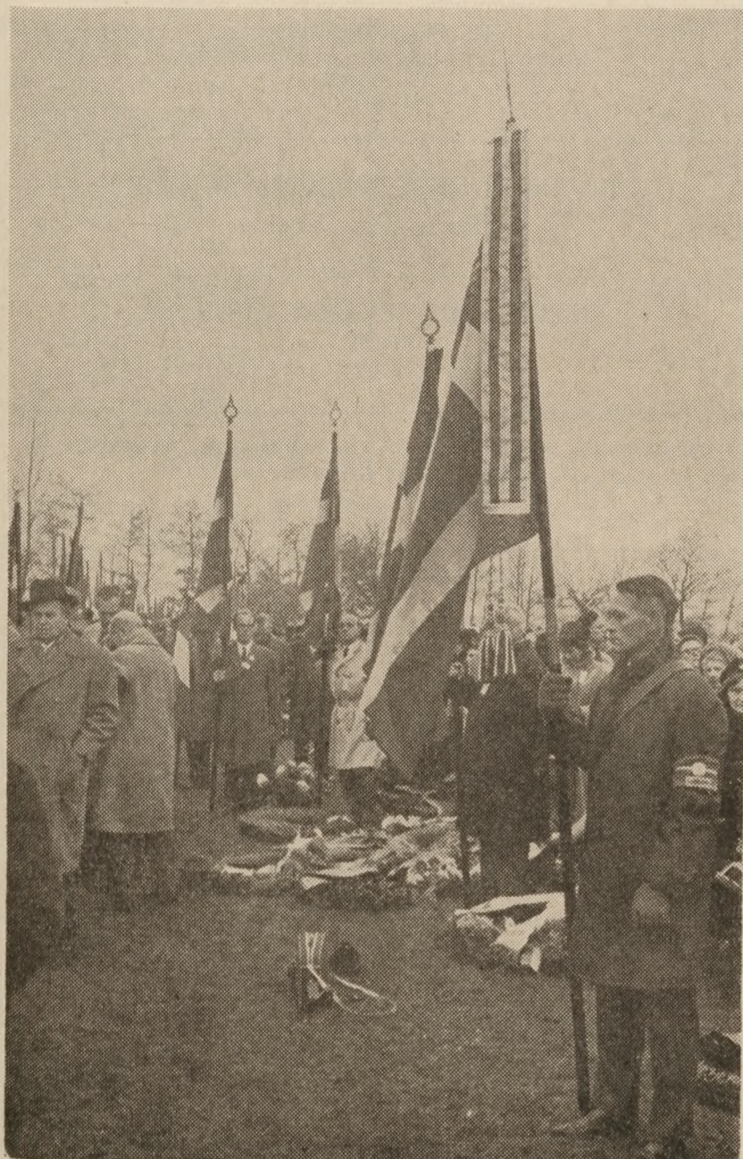
Fra indvielsen af mindesmærket ved den tidligere koncentrationslejr Neuengamme ved Hamburg den 7. november 1965. På billedet ses den danske faneborg. I forgrunden ses Landsforeningens fane skænket af Danmarkssamfundet.

Ladelund. Ligesom i de foregående år havde Ladelund i søndags besøg af repræ-