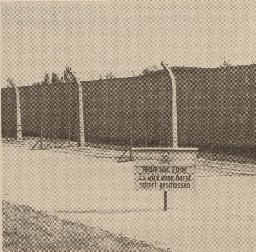
Dødningshoved, der advarer mod pigtråd med højspænding, der „værnede“ hele lejrområdet.

Omkring 30 kilometer nordvest for Berlin ligger et — om man tør sige det — yndet udflugtsmål, et af de mål for søndagsturen, den gamle tyske hovedstad er rig på. Dette sted er sandelig også minderigt, skønt i nok så dystert forstand. For den hel-dagstur en søndag, de østtyske værter har tilrettelagt, går omkring det Berlin, hvis ene part igen er hovedstad — for Den Tyske Demokratiske Republik — og turen starter med Sachsenhausen.