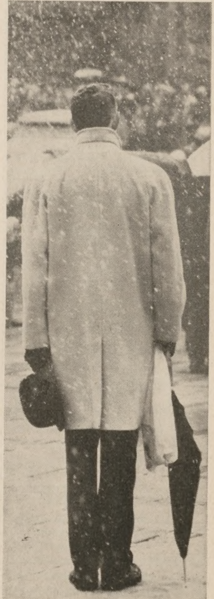
9. april på Rådhuspladsen.

Også fra Frankrig har man indkaldt dokumenter, der afslører, at dr. Best