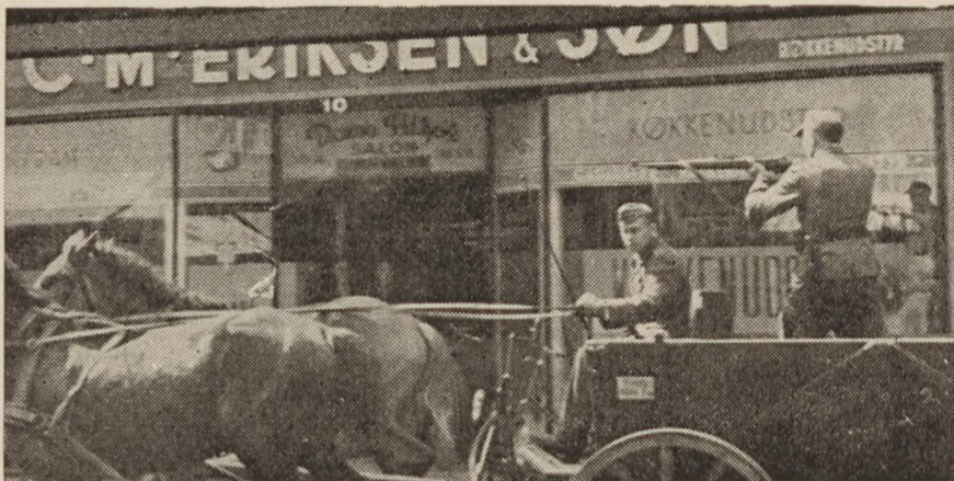
Tyske soldater i Odense 29. august 1943.

Frihedskampens mål kan ses som menneskerettighederne, en kamp mod uret og undertrykkelse, menneskeforagt og menneskeforagelse. Den indignation, som unge i dag i høj grad savner et sandt mål for, kan måske her samle sig om race- og folkeundertrykkelser ude i verden i dag og herfra overføres til det hjemlige, nære, ganske uheroiske plan.