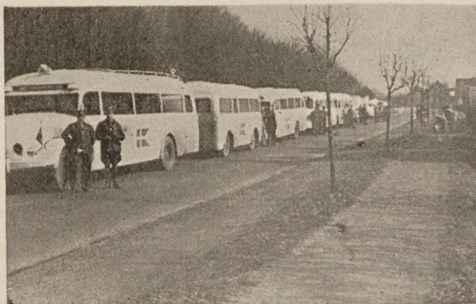
De hvide busser blev en af okkulationsårenes skønneste oplevelser.